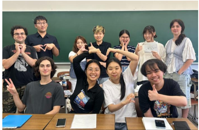
圖二、日本語五的同學