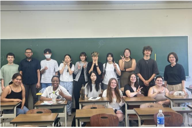
圖一、日本語四的同學