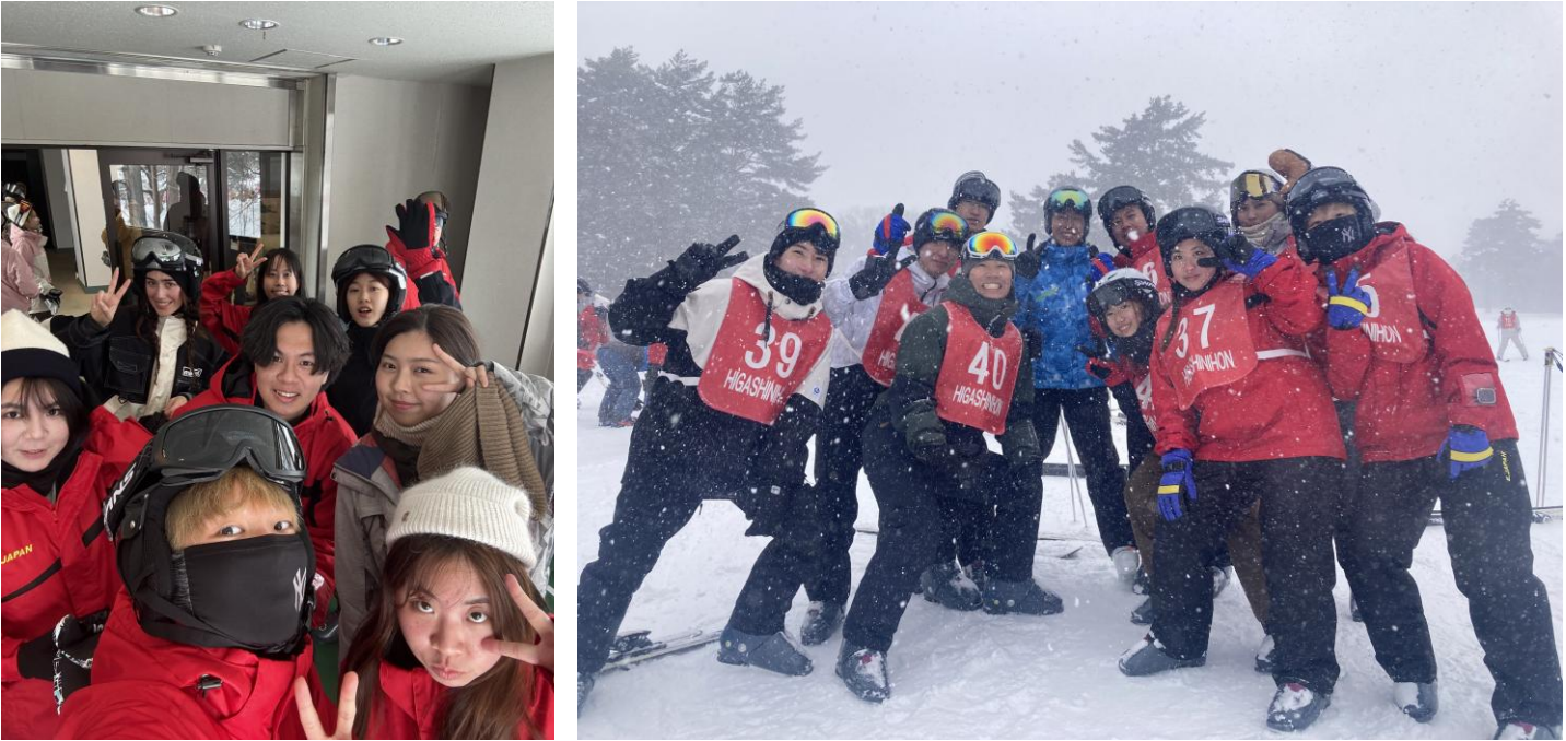
圖：太冷了，我是有戴面罩的那個

四天下來，從一開始完全不會滑，到後來已經能搭纜車上山再自己滑下來，成就感很大。而且還能和朋友一起住在滑雪場裡，有點像畢業旅行的感覺，氣氛非常熱鬧，也留下了很特別的回憶。