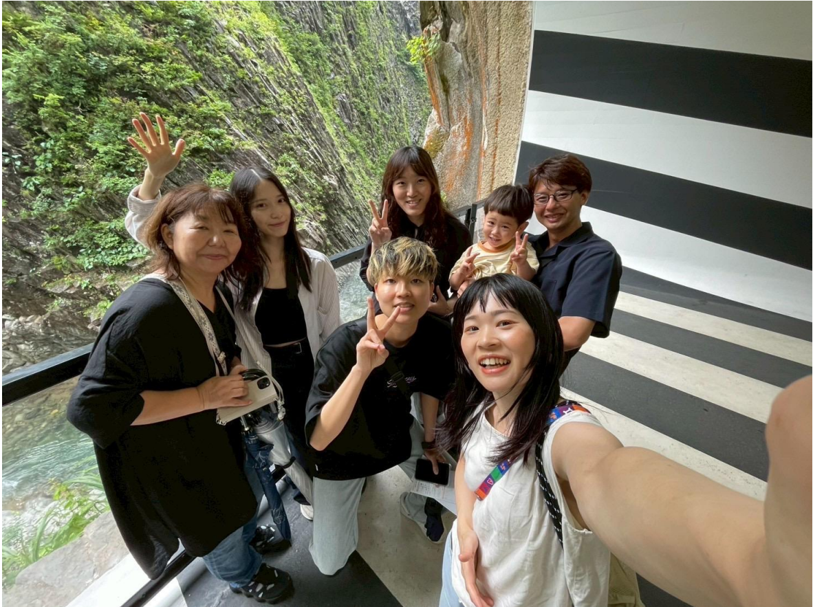
圖：跟寄宿家庭一起出去玩