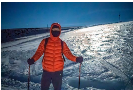
與滿月的雪地合影

在哈恩大學生活期間，我意外發現學校提供許多戶外活動，其中最令我難忘的是參加「雪地健行」(Snowshoeing)。我跟隨一群西班牙同學來到哈恩最近的雪山(Sierra Nevada)，難以想像在印象中屬於熱帶的西班牙，竟有如此壯闊的雪山景色。過程中我的體力完全跟不上歐洲的朋友，但同伴們還是願意放慢腳步陪伴我，最後我們在雪山上一同見證了滿月的壯麗景色。這段經歷不僅讓我突破身體的極限，也讓我體會到歐洲人熱愛自然與團隊互助的精神。