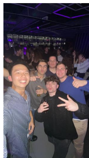
酒吧認識的西班牙朋友