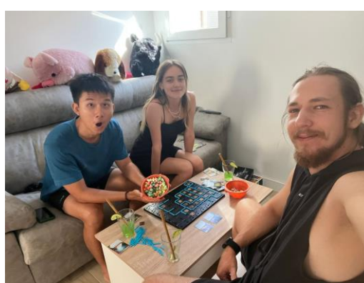
與烏克蘭朋友的日常