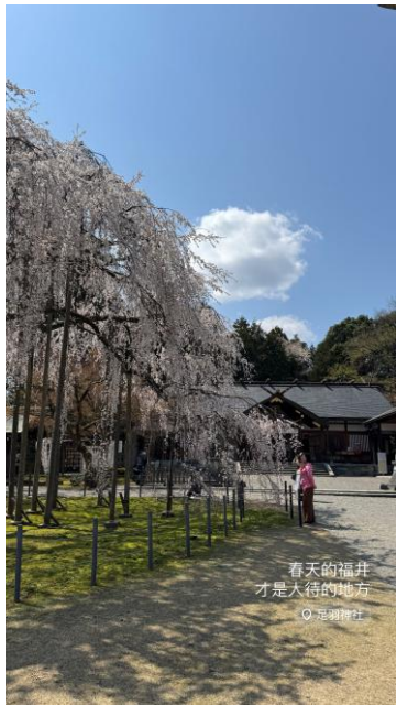
▲足羽神社百年櫻花樹