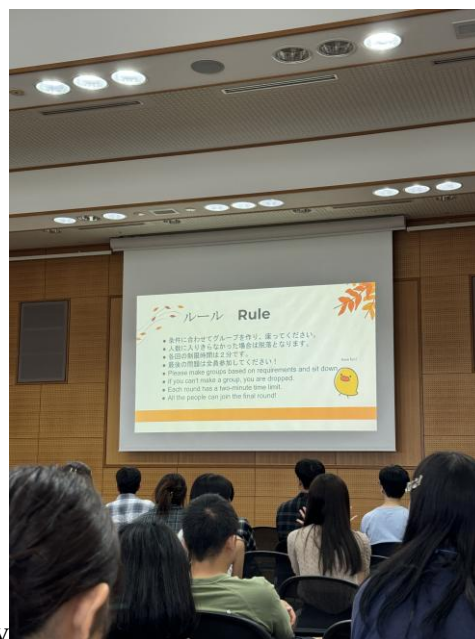
▲orientation 最後一天的破冰活動