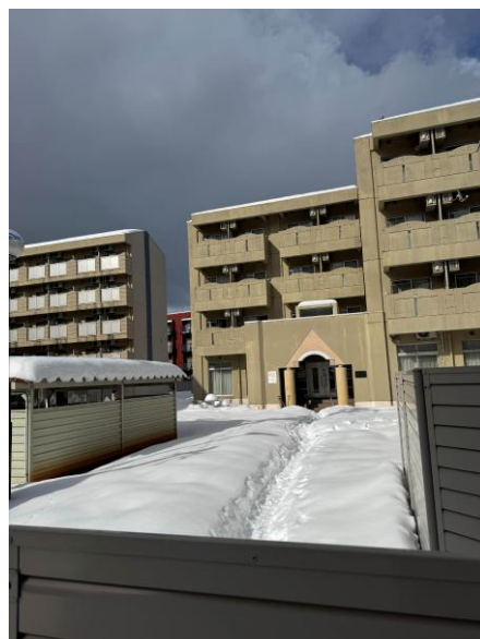
▲留學生會館門口的積雪