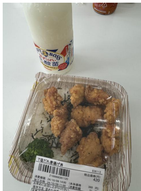
▲學餐旁商店賣的便當