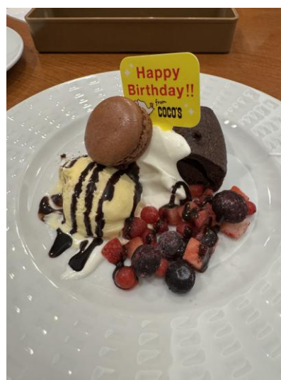
▲ココス壽星免費生日蛋糕