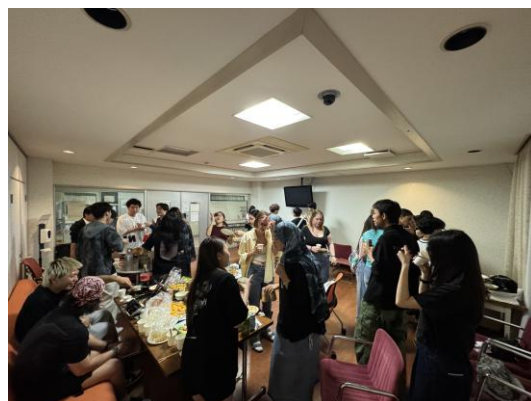
▲某留學生的生日派對