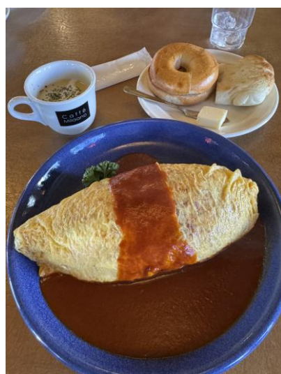
▲ニシムラカフェ的蛋包飯