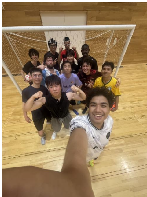
▲跟其他留學生踢足球