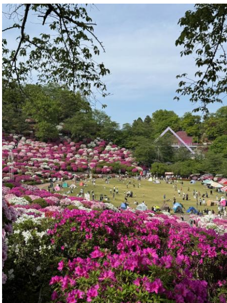
▲西山公園杜鵑花(有祭典)