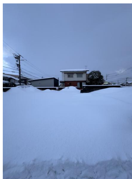
▲ 路邊的積雪 (除雪車會把車道的雪除到人行道上)