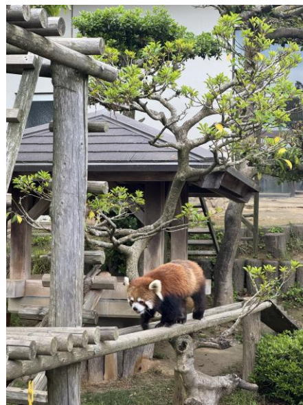
▲西山公園動物園的小貓熊