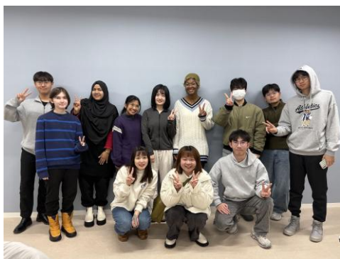
▲ 総合2 全班與り一先生合照

福井大學有一個語言學習的 support 叫做 U-PASS，U-PASS 有一個系統可以預約 tutor 學日文或是英文，而且 tutor 的英文都很好，可以請 tutor 用英文解釋一些日文的用法，我自己是會在會話考試前找 tutor 練習，有跟 tutor 練習過後，正式考試基本上可以拿到滿分。