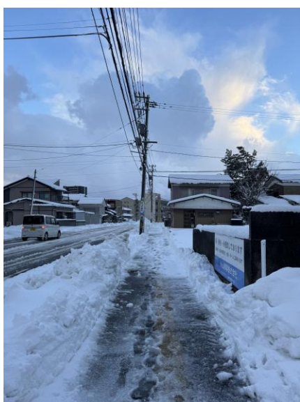
▲ 冬天路上的積雪 (要注意有些地方是冰非常滑)

冬天很常就是睡一覺起床後，世界又變得不一樣，積雪又更深了，要注意氣象廳的公告，如果隔天會下大雪的話，前一天要先出門把食材買好，要不然下大雪出門會非常麻煩，也要注意課程如果停課的話，會有什麼應對措施。另外冬天出門玩的話要有電車隨時可能會因為大學停駛或延誤的狀況，我自己有遇過一次，我當時是坐福井的越前鐵道(echizen)要回宿舍，到車站時才看到公告說因為大雪已經停駛了，等於說如果不坐計程車或是其他交通方式的話，我們是回不了宿舍的，不過幸好當時有一輛計程車停在車站外，我們才趕緊坐計程車去最近的JR 車站，雖然 JR 也延誤了 1 個小時多，最後還是有坐到車回到宿舍。