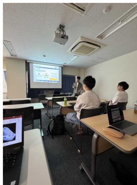
▲在春季新學期開始時報告我的論文 給實驗室的成員