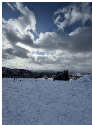
▲滑雪場最簡單的雪道

此外我在7月中時有報名參加あわら市の金津神社的扛轎活動，這是當地神社的活動，然後市役所邀請福井大學的留學生報名幫忙，說是幫忙但我們更像是去體驗的。當天要換神社提供的法披以及白色短褲，整個打扮完完全全就是電視裡看到祭典裡的人的穿著打扮，參加的人主要以當地人為主，也有很多看起來是學生或是中年人參加，是個與當地人接觸的好機會，而且會去扛轎的日本人通常個性都很開朗活潑，完全不會怕跟外國人互動。