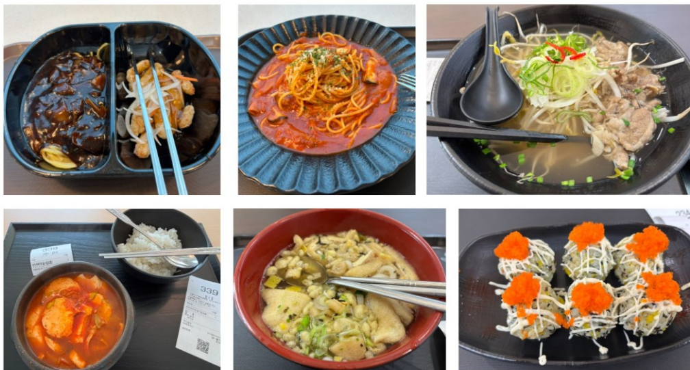
圖四、學校餐廳的各式菜色