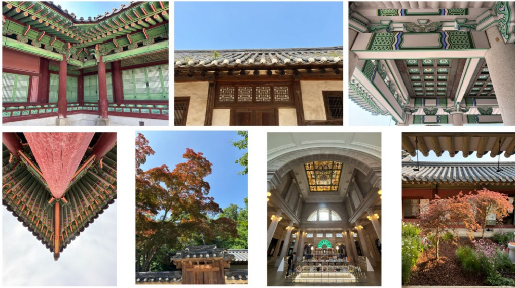
圖五、依序為華城行宮、昌德宮、青瓦台、東廟、後苑、首爾車站及昌慶宮