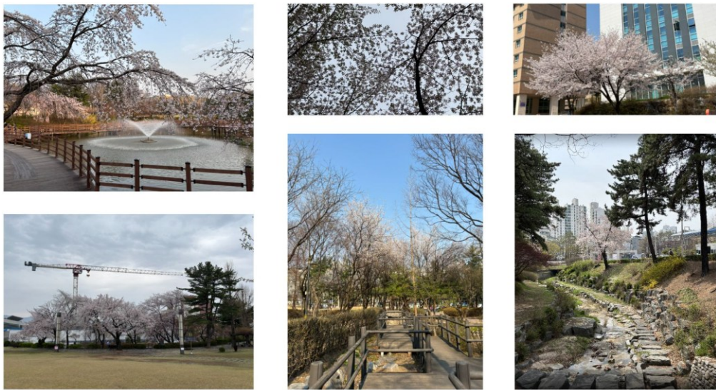
圖三、首爾科技大學櫻花盛開時的景色