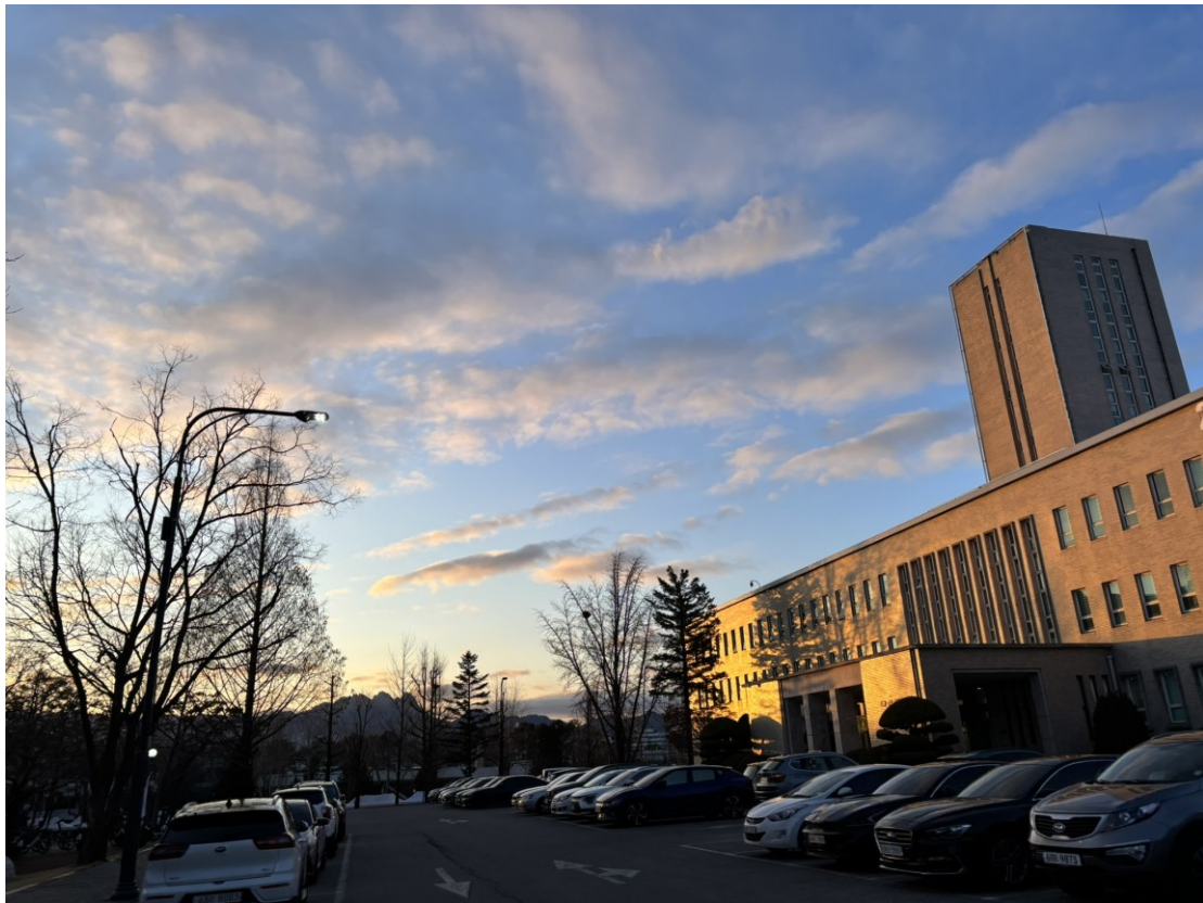
圖一、首爾科技大學三月時的景色