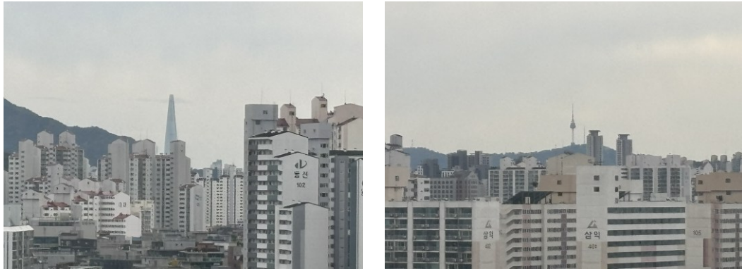
圖二、宿舍窗外風景，可看見樂天塔和首爾塔