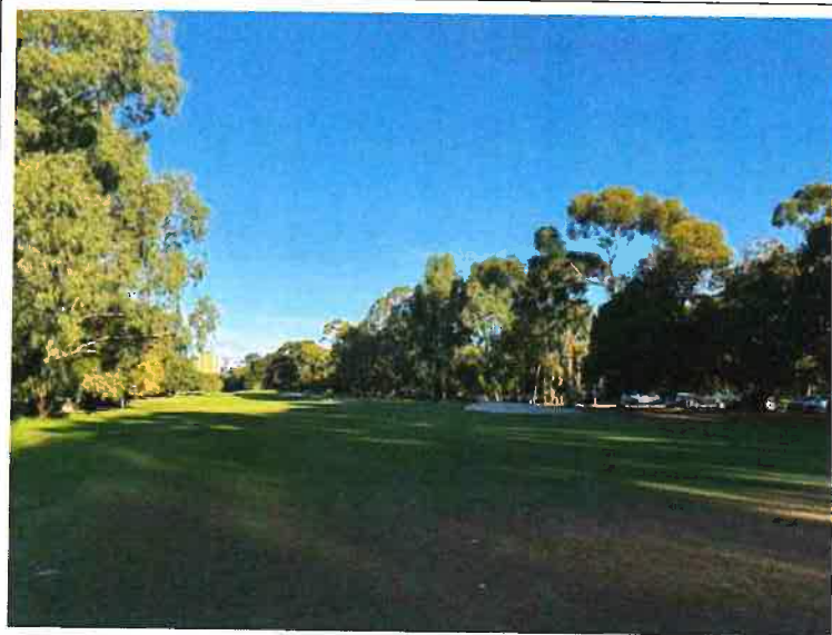
North Adelaide Golf Club 的 South Course