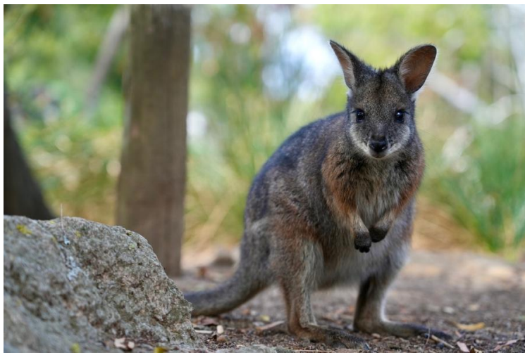
Cleland Wildlife Park 的袋鼠