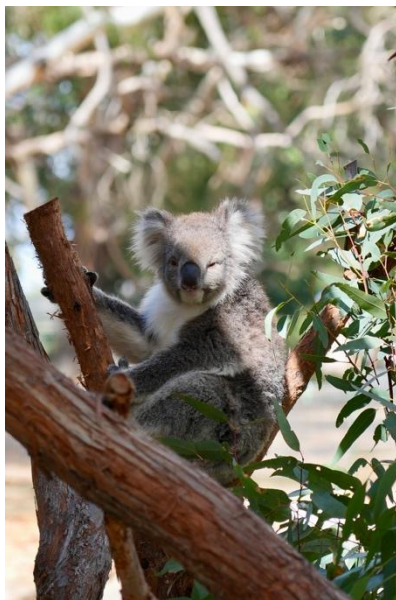
Cleland Wildlife Park 的無尾熊