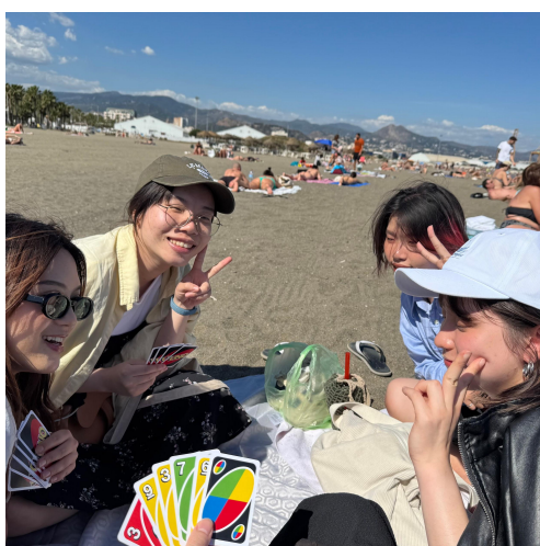
圖（九）享受西班牙海灘