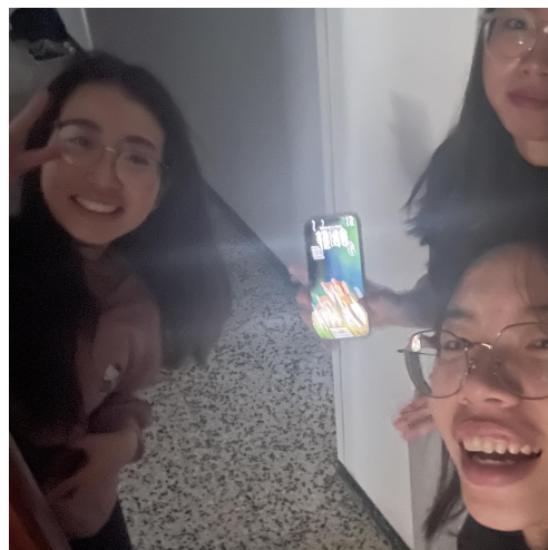
圖（十四）度過西班牙大停電