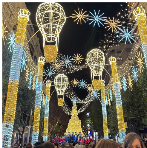
圖（二）哈恩聖誕點燈、合唱