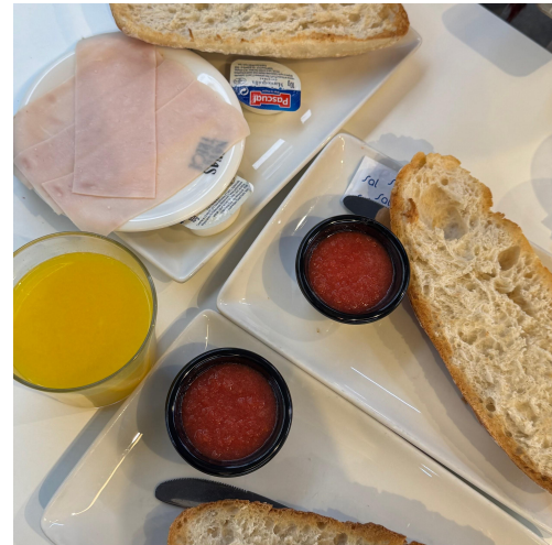
圖（六）安達魯西亞經典早餐