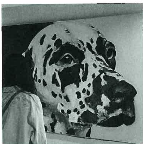
圖（十三）參觀學校特展