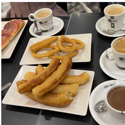
圖（十一）西班牙必吃 Churro