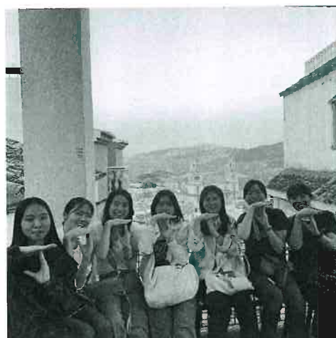
圖（十二）跟哈恩主教堂合照