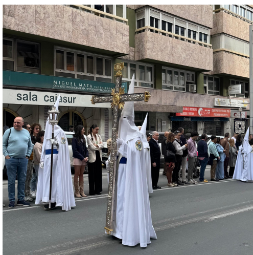
圖（三）聖週遊行—穿著白袍的苦行者