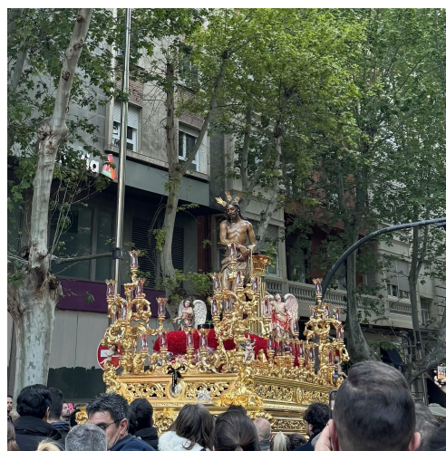
圖（四）跟當地居民參與聖週遊行