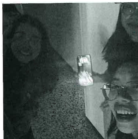
圖（十四）度過西班牙大停電