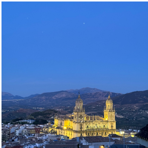
圖（七）日落時的哈恩主教堂