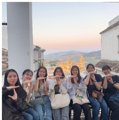
圖（十二）跟哈恩主教堂合照