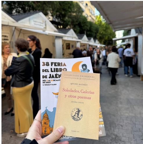
圖（五）哈恩當地舉辦的書展