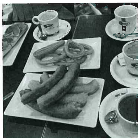
圖（十一）西班牙必吃 Churro