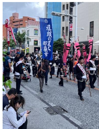
那霸大綱拔河祭典及煙火慶祝