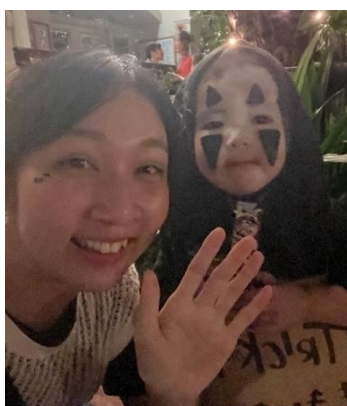
萬聖節時的美國村非常熱鬧