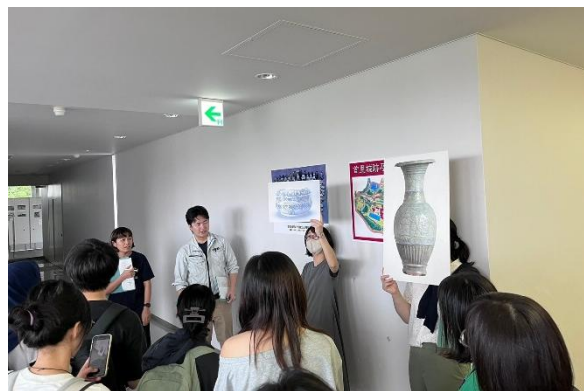
以上為沖繩文化與歷史的校外教學參訪