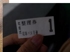
沖繩的悠遊卡(OKICA 卡)，搭公車或單軌都可刷，又或者上公車需抽整理券