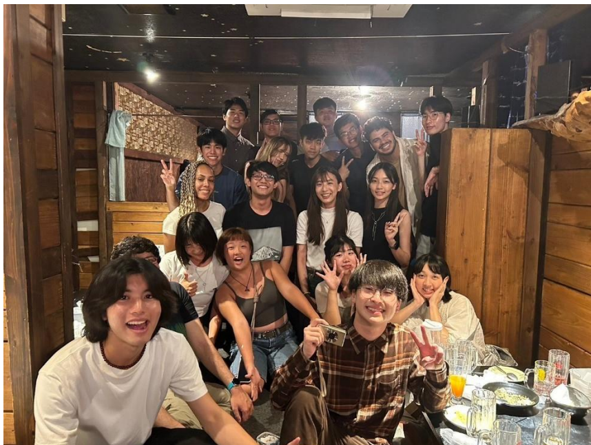
交換生的歡迎派對