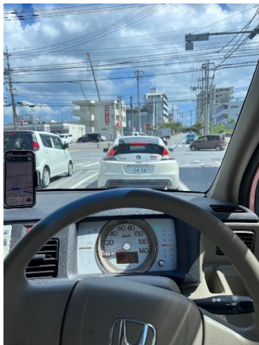
第一次在沖繩上路

在交換之前曾經到日本本島旅行過，沖繩則是第一次，來到沖繩之後發現氛圍和本島完全不一樣，可能是因為沖繩有美軍駐紮又是觀光勝地，外國人相對較多的關係，所以氛圍很 chill，在沖繩生活了五個多月真心覺得沖繩好適合生活。除此之外讓我感受到最大的文化衝擊是交通問題，想在沖繩生活，有車子能夠當交通工具是最好的，而我也成功地在沖繩駕駛，雖然日本是右駕與台灣不同，但行駛卻比台灣安全好幾倍，這讓我意識到日本/沖繩人開車的素養，平均時速大約 40~80 而已，且行人絕對優先是他們從小到大灌輸的觀念，前年台灣也開始實施行人優先的新制度，但如果想要普及化，可能還需要很長的一段時間。