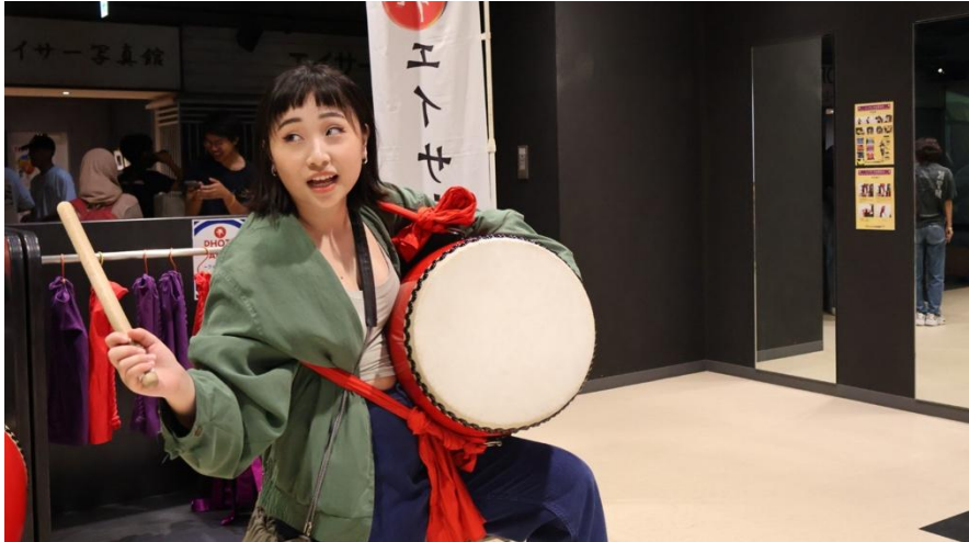
エイサ博物館校外參訪