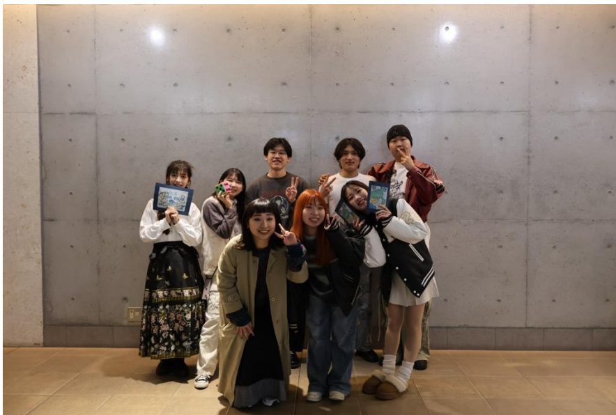
Glocal Festival 組員合照