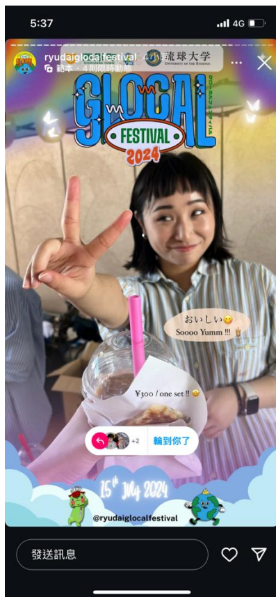
Glocal Festival 活動日照片