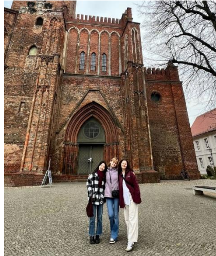
圖六、參訪布蘭登堡教堂

本課程從多元的角度切入，涵蓋德國的社會、經濟、政治和文化等層面，讓學生全面了解這個國家的歷史背景和當代發展。這門課程對於熟悉德國文化以及跨文化溝通有很大幫助。