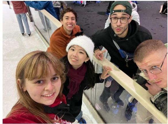
圖十、與交換生去柏林溜冰