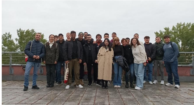
圖四、同期所有交換生的第一張合影