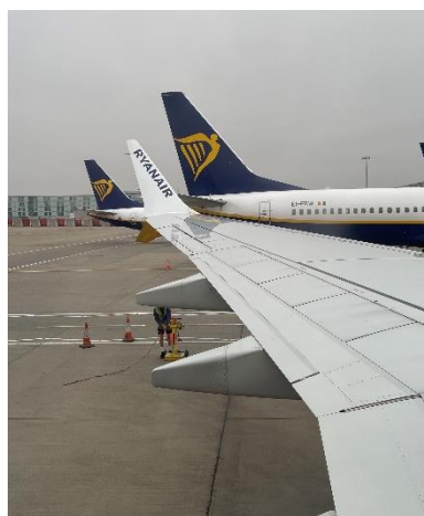
圖十二、廉航是環歐的好夥伴

德國地處歐洲中心，交通非常便利，尤其是柏林機場的航點豐富，搭乘廉價航空或長途巴士（如 FlixBus）都是極佳的選擇。在交換期間，我造訪了捷克、奧地利、匈牙利、比利時、荷蘭、波蘭、英國、義大利、西班牙、葡萄牙和法國等國家。雖然相比其他台灣交換生，我去的國家不算多，但我始終秉持「量力而行」的原則，按照自己的經濟能力規劃行程，每一次旅行都充滿驚喜與收穫。回首這段經驗，我深感這些學習、互動與旅行的點滴將成為我一生難忘的回憶，也對我未來的生活產生深遠的影響。大家也可以加入各種歐洲交換生的社團或群組，除了資訊的交流外，也可以在出去旅遊時徵徵看沙發。