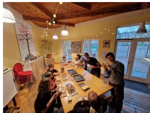
圖八、三國的美食試吃