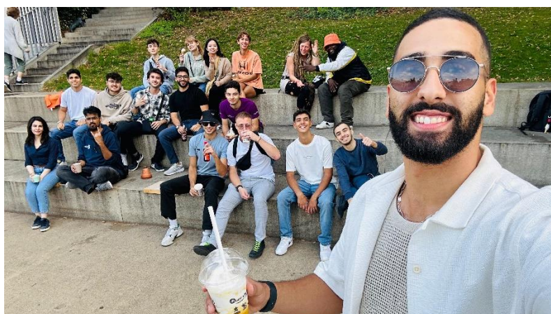
圖三、交換生與學伴們在河畔聊天、吃 Gelato

交換期間，突破了長期以來對於使用英文的恐懼感。之前在台灣，擔心自己的語法錯誤或者口音問題，常讓我在與人交談時感到緊張。然而，出國後我發現，並不是每個外國人都能流利地使用英語，而語言的核心是溝通而非完美的表達。即便語言能力有限，只要調整方式，善用肢體語言或換句話說，都能讓對方理解。在這過程中，我逐漸釋懷對語言錯誤的恐懼，開始可以比較自信地與人交流。無論是課堂討論還是日常生活，這樣的練習讓我累積了各種生活化的表達方式，也更熟悉如何在不同情境下調整語氣和用詞。語言不再是一個障礙，而成為我自由探索世界的橋樑。