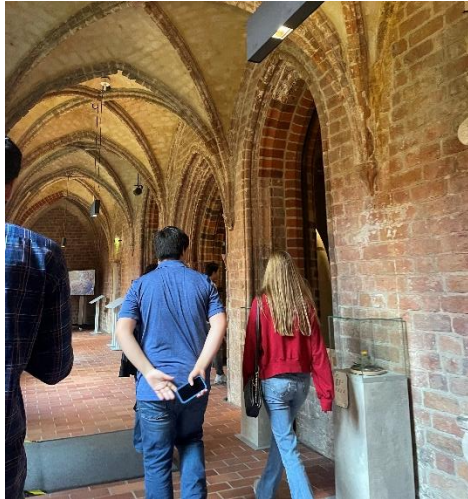
圖五、參訪考古博物館