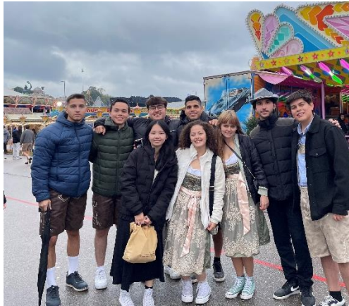
圖九、與交換生在慕尼黑啤酒節