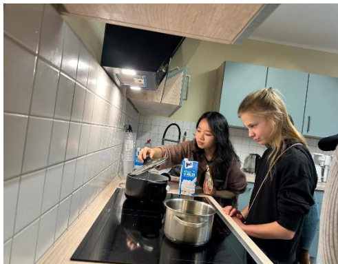
圖七、教小朋友煮珍奶

值得一提的是，德國對珍珠奶茶的認識多限於使用爆爆珠的版本，真正的黑糖珍珠對他們來說是全新的體驗。活動當天，小朋友對珍珠奶茶的反應非常兩極：有的小朋友喝一口就不再嘗試，但也有小朋友愛不釋手，還要求續杯！最後我的黑糖珍珠奶茶順利 sold out，這讓我感到驚喜又成就滿滿。