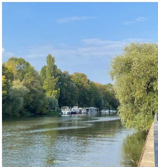
圖二、學校附近的哈弗爾河畔

布蘭登堡市是一個古典與現代交融的小鎮，距離首都柏林約 1 小時火車車程，為一座有 1050 年歷史的古老城市，保存多棟中世紀的美麗紅磚建築，周邊呈現森林與田園景色，遍佈著湖泊、河流，成為當地居民運動休憩的好去處。整潔的城市街道和傳統建築相輔相成，電車穿梭其中，營造出悠閒的生活節奏。小鎮被河流環繞，河面上隨處可見小船，居民的日常生活與河流密不可分。鎮上還保留了许多歷史遺跡，如老教堂、鐘塔和古堡，令人宛如置身於歷史畫卷中。