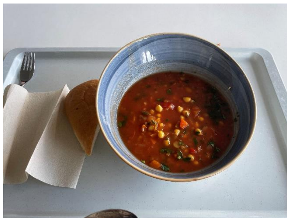
圖十一、學校食堂餐點

學校的食堂其實還不錯，除了有我不太愛的生菜，整體味道讓人滿意，但因為我更偏好自己煮飯，所以只去過幾次。這段經驗讓我學會了更好地規劃飲食，並在烹飪中找到樂趣與滿足感。