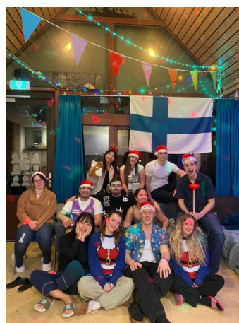
宿舍聖誕節交換禮物