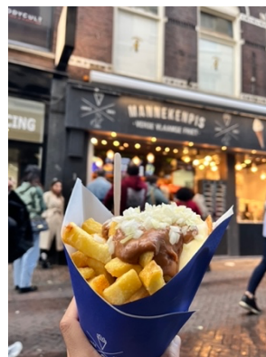
荷蘭薯條 feat. 咖哩洋蔥醬

來到歐洲，光是喝水就大有學問。在飲水機不常見的情況下，主要可以喝到兩種水：第一種是水龍頭打開就可以喝的 Tap water (又依歐洲各國的水源和濾水系統品質不同)，荷蘭的水算是乾淨，但能不能接受喝硬水因人而異。另外也可以買到飲用水，分為有氣泡的 Sparkling Water 和沒有氣泡的 Still / mineral / ordinary water，後者就是亞洲人一般喝的白開水，但是如果不想一直花錢和跑來跑去，也可以直接買濾水壺。