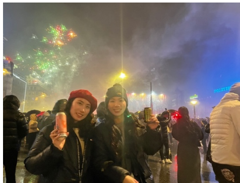
哥本哈根跨年煙火

如果說在荷蘭是拓展對設計發展的認知，那在北歐四國的夢幻旅行更是讓我體驗到在歐洲生活的真實面向。在以重視人權自由及環保聞名的荷蘭，有排擠、歧視難民，並且獲得許多人民支持的黨派；而即使在社會福利制度完善的北歐國家，走在零下 10 度冰天雪地的路上還是有無家可歸的遊民；在有溫馨聖誕老人村的芬蘭，也有因為宗教立場不同而被政府漠視，導致語言和文化出現傳承危機的北歐原住民薩米族。