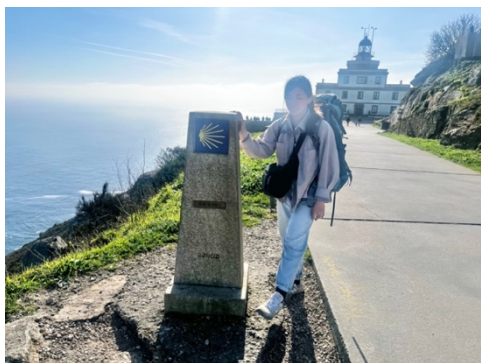
西班牙朝聖之路盡頭