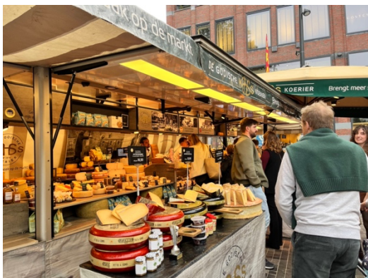
市場常見的起司攤販