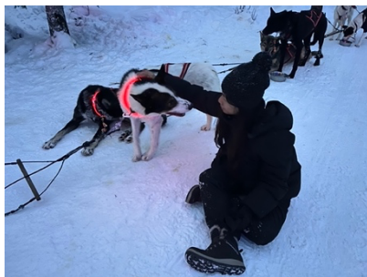
聖誕老人村哈士奇