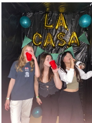
宿舍 LACASA 派對

如果說在荷蘭是拓展對設計發展的認知，那在北歐四國的夢幻旅行更是讓我體驗到在歐洲生活的真實面向。在以重視人權自由及環保聞名的荷蘭，有排擠、歧視難民，並且獲得許多人民支持的黨派；而即使在社會福利制度完善的北歐國家，走在零下 10 度冰天雪地的路上還是有無家可歸的遊民；在有溫馨聖誕老人村的芬蘭，也有因為宗教立場不同而被政府漠視，導致語言和文化出現傳承危機的北歐原住民薩米族。