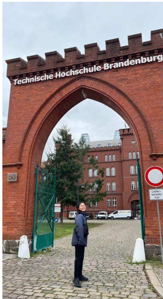
布蘭登堡科技大學 校門合照