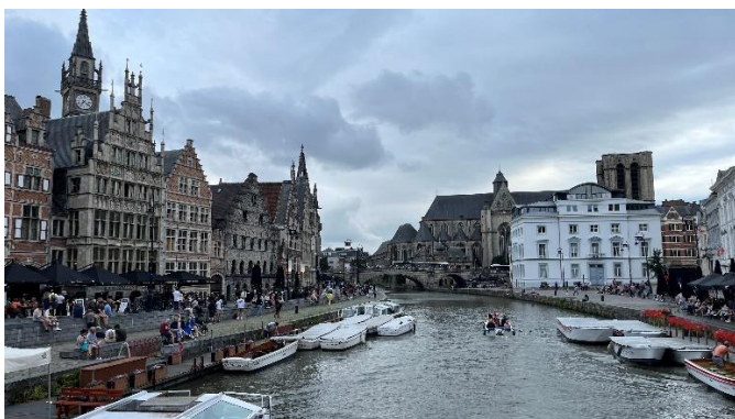
↑ 比利時根特 香草河岸

因為歐洲國家之間地理位置相近，讓我能夠自由地探索德國和鄰近國家的魅力，體驗各地的文化與風景。交換期間我到過許多鄰近的國家和城市旅遊，像是丹麥、波蘭、匈牙利、奧地利、薩爾斯堡與哈修塔特，還有荷蘭、比利時、盧森堡、捷克以及不同的德國城市。值得一提的是，今年的夏季學期，學生證升級為全德國通票，這張通票讓我在德國境內的慢車、城市公共交通以及部分跨國火車上能免費搭乘，讓我在旅行中省下了不少交通費用。強烈推薦未來到歐洲交換的同學，不要錯過學生身分的多項優惠，再加上地理位置的優勢後，四處去旅行真的是充滿樂趣又能豐富人生閱歷。