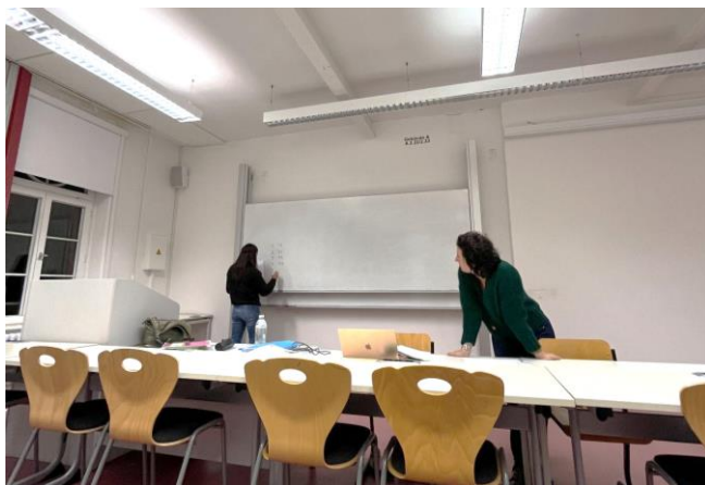
↑ 德文課 課堂紀錄

語言學習是一個需要長時間積累的過程，很少會帶來立即的成就感，尤其對於像德文這個語言，有複雜的文法與架構，文法與句型架構都是需要時間去消化和掌握，並非短時間內能夠習得並融會貫通。在一整個學期，僅大約十幾堂課中，絕對不可能在修完後，馬上就能應付日常生活或完全聽懂德國人的對話。因此，我會推薦來交換的同學，也想要學習一點基本德文的同學選修這堂課，或是有學分考量，這門課也是一個不錯的選擇。但如果你另有規劃，像我後期是選擇到外面的語言班進修德文，這時就可以把學校提供的德文課，當成可有可無的選項就好。以我自己的感受來說，我會覺得從課堂中學習一些基礎的德文用語，即便只是簡單的打招呼或是基本對話，不管對於平時生活上或是在超市結帳時，能與路人及收銀員運用基本打招呼或祝福語句這些方面上來說，選修德文絕對是有益無害的。