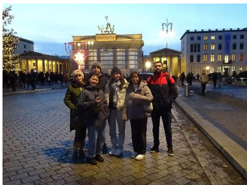
→ 與修課同學在布蘭登堡門合影

授徒步環鎮，那時候正好是冬天，天氣非常寒冷，路面堆積著很多雪，結冰的地面很滑，但教授依然健步如飛，絲毫沒有受到氣候的影響。那一堂課走下來，我們甚至走了超過兩萬步呢！