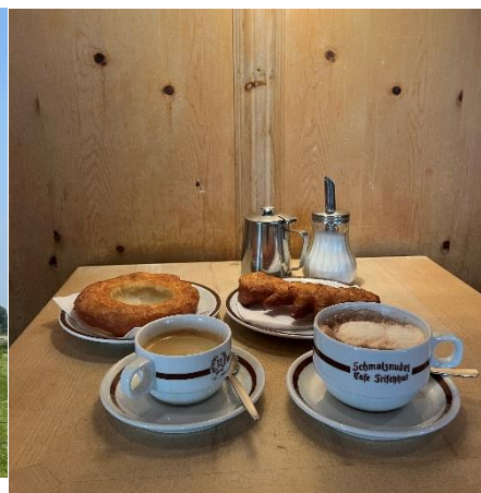
↑ 慕尼黑 甜甜圈老店