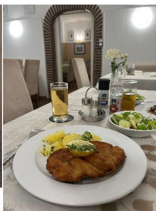
↑ 維也納 炸豬排