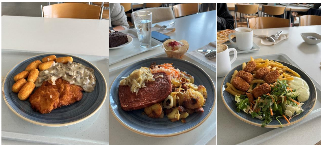
📍學校的學餐，每日菜單可在餐廳內或 App 上看到

建議在前往德國之前，最好能夠學習一些德文，非常不建議完全零基礎，因為小至超市購物大至火車站廣播都脫離不了德文。若對德文一無所知，在生活中難免會面臨不少困難和不便。例如，在火車站，像柏林這樣的首都城市中，僅有主要車站（如柏林中央車站）會提供英文廣播，其餘車站的廣播通常只有德文。此外，S-Bahn 和 U-Bahn 的廣播也是全德文的，車站內的時刻表也未必會有英文標註。如果遇到突發情況，像是臨時更換月台、火車取消或停駛的消息，當下通常只有德文廣播，很少還會再有英文。另外，學校的學餐以及鎮上超市的員工也是無法用英文交流溝通的。在這樣的情況下，如果聽不懂德文，有時真的會帶來相當大的恐慌。因此，提前學習一些基礎德文，是可以減少很多不必要的困擾和焦慮的。