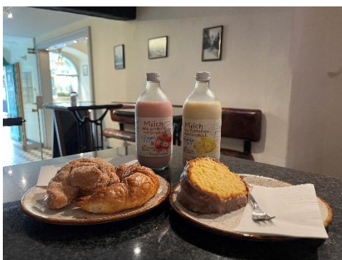
↑ 班貝格 500年歷史麵包店