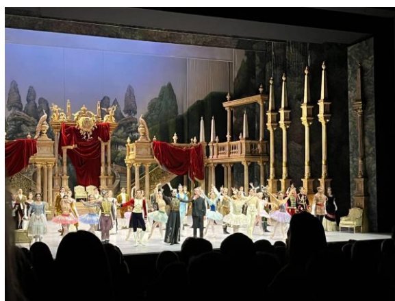
← 《睡美人》芭蕾舞劇謝幕

在到德國交換的這一年裡，我有幸親身體驗歐洲的表演藝術風氣。在柏林，我欣賞了歌劇《弄臣》、《魔笛》、芭蕾舞劇《睡美人》；在漢堡，我沉浸於易北愛樂樂團的音樂之中，並觀看了經典歌劇《卡門》；在萊比錫，欣賞布商大廈管弦樂團的精彩演出；在維也納，我到金色大廳聆聽了一場宏偉的交響樂演出，並在理蒙德劇院觀賞《歌劇魅影》；在慕尼黑，我被慕尼黑愛樂的音樂深深打動，還欣賞了《奧涅金》芭蕾舞劇。