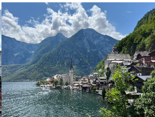
↑ 奧地利 哈修塔特