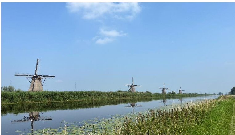
↑ 荷蘭 小孩堤防