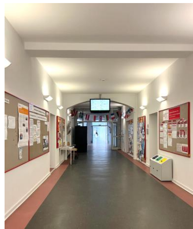
← 行政大樓兼管院走廊