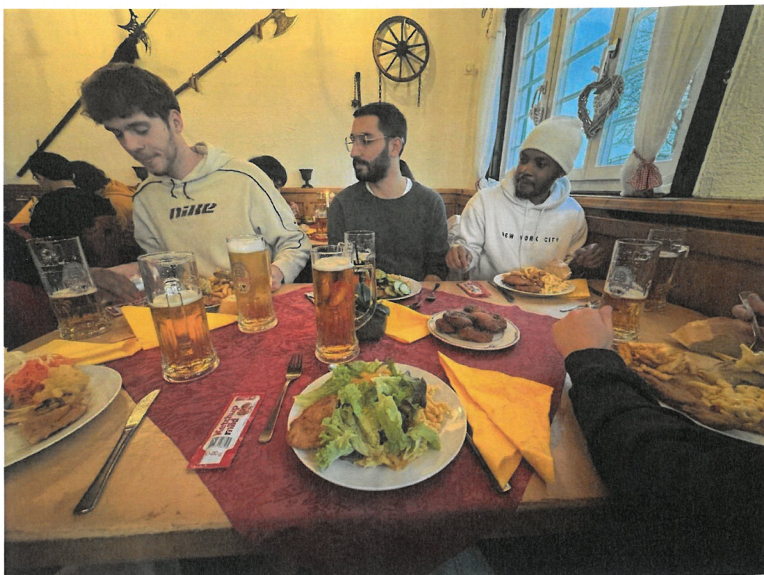
學校組織交換學生聚餐，來認識不同國家的交換生

再來就是危機處理能力，在歐洲人生地不熟，再加上語言與文化差異的問題，有時候就是不要害怕去詢問當地人問題，雖然可能得到的答案不是你需要的，但多嘗試總不會錯。