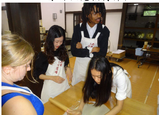
▲ 傳統產業-手作蕎麥麵