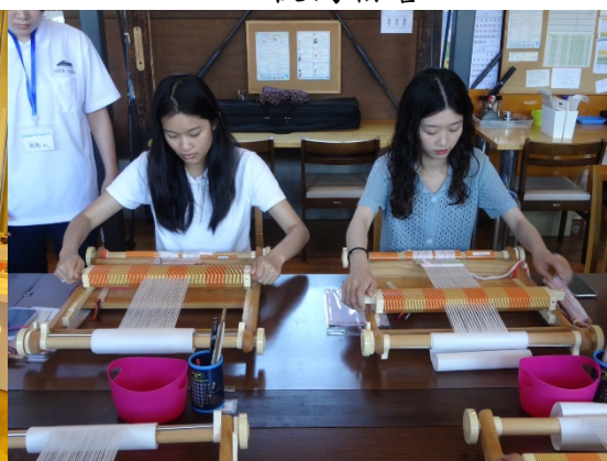
▲ 傳統產業-紡織體驗