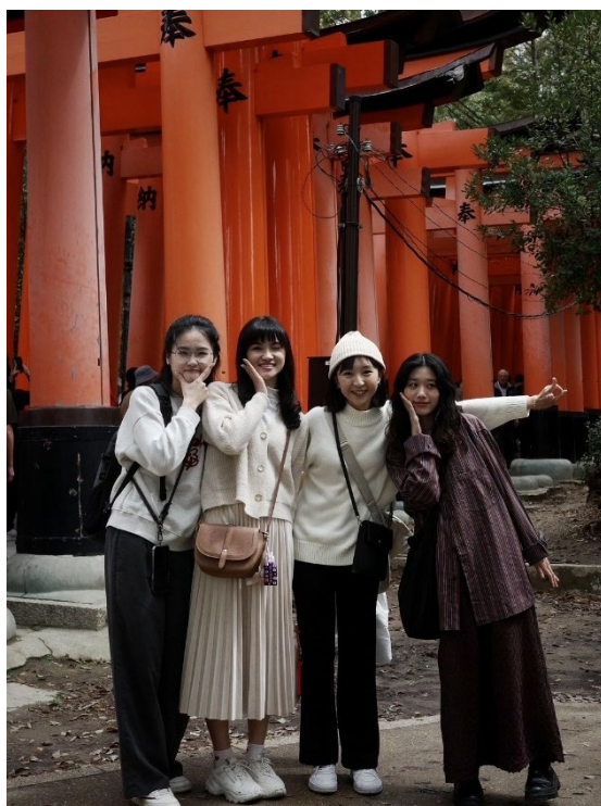
▲ 京都伏見稻荷神社