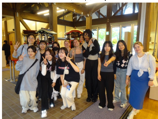
▲ 傳統產業-越前漆器