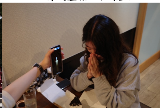
▲ 第一次在日本過生日