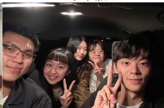
▲ 六呂師高原看星星