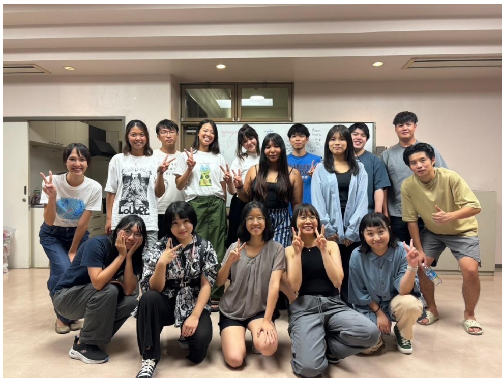
各國學生一起舉辦的料理會