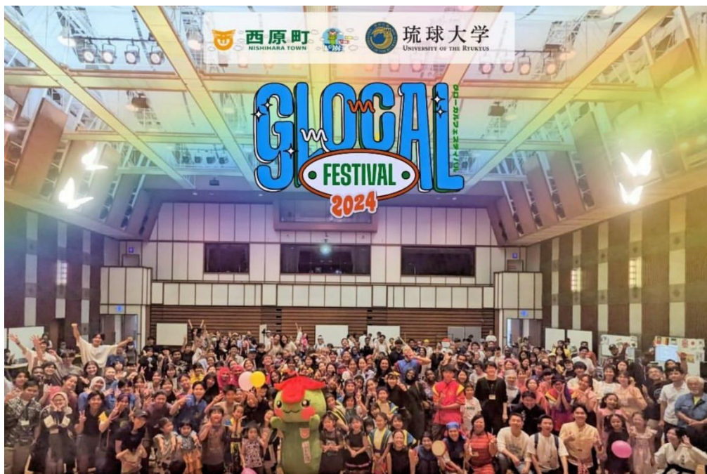
GLOCAL FESTIVAL 團體大合照