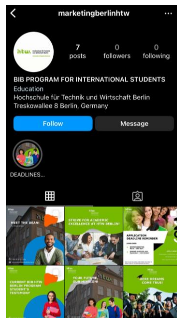
行銷課程內容製作

其中我發現南美洲的學校在這方面做了最多準備及推廣，不僅為本地學生增加他們與國際接軌的機會，也為他們創造更多到海外交流的管道。