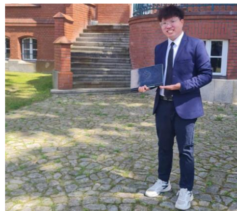
圖 7. 期末作品