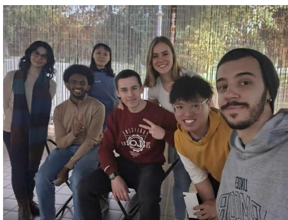
圖 3. 交換生們一起上歷史課

一學期上 5~6 堂（每個月 1~2 堂），固定週六上課時間為三小時。這堂課應該是最輕鬆也是最有趣的一堂課了。因為上課內容就是帶我們到處去參觀博物館和景點，甚至最后兩堂課其中一堂是帶我們去划獨木舟，另一堂帶我們去柏林的各大景點還有很難得才能進去參觀的德國柏林聯邦議院。並且這是這堂課是全部交換生會一起上，所以像是我們這群已經打成一片的交換們把這堂課變得更加有趣。Dr. Kohnke 對柏林和布蘭登堡的歷史非常瞭解，而且沒期末考試和報告，以出缺席來決定期末分數。（不過那麼輕鬆有趣難得的課應該沒人會想翹課吧??）