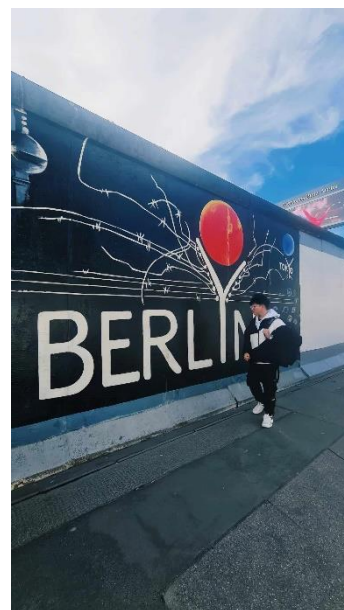
圖 18. 德國柏林東邊畫廊