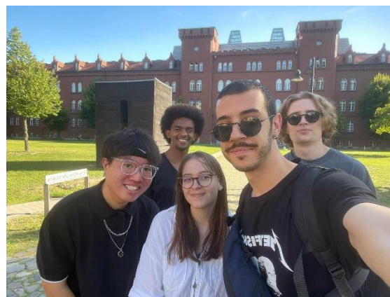
圖 20. 離別前夕(II)