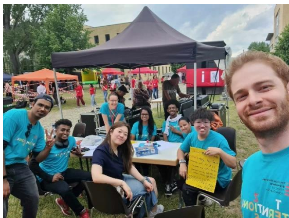
圖 8. 校園開發與招生日（國際生們）

在這趟德國交換的期間，我認識了非常多來自世界各地不同國家的朋友們。在學校，最要好的莫過於就是我們這一群一起來交換的學生，因為剛好這學期我們交換生人數不多只有我們六位，兩位來自土耳其，兩位來自波蘭，一位來自非洲的衣索比亞，還有就是來自東南亞馬來西亞的我。所以我們剛認識的第三天就一起約去柏林玩然後馬上就變得像家人一樣每天互相照顧與照應了。另外五月中的時候剛好是學校的校園開放與招生日，我也作為馬來西亞的代表負責中文，英文，馬來文與印尼文的翻譯，而那一天我也遇到和認識了更多這間學校的國際生，有來自印度，斯里蘭卡，韓國，蘇丹…，總之大家真的來自很多不同的國家，我也和大家相處得非常要好，還互相留了社交媒體聯絡方式到今天都有在互相聯絡。最后，因為這五個月期間我在歐洲獨旅了17個國家，在每個國家我都有遇到和認識當地人或國際的旅客，而且哪怕只有我獨自一人旅游我也很大膽地到處請別人幫我拍照（所以我的社交能力已經是幾乎滿等了）。