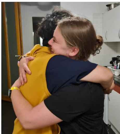
圖 21. 道別