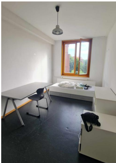
圖 15. 宿舍房間

會使用它兩次（午餐和晚餐），只有一個原因就是歐洲的物價真的高得嚇死人了。我從以前就聽他們說在歐洲要自己煮生活費才不會那麼高，我想說至少兩天在外吃一餐應該沒什麼問題不會太誇張吧？結果當我親自來到歐洲，那物價高的比我預期中還要誇張。在外吃一餐的金額拿來買菜的話可以吃一個禮拜了。幸好我在台灣生活時就有在學習烹飪廚藝，原來是爲了來交換時學以致用啊~