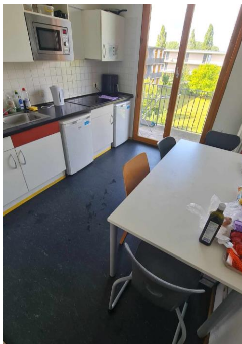
圖 16. 宿舍廚房

看了我選課說明的課堂時間會發現，除了基礎德語課是每週固定要上課兩小時外，另外兩堂課是一學期只有四至六堂，這就表示我大多數的週期幾乎是只有一天那兩小時有上課，其餘六天都是沒課的狀態。想找打工但因為只待五個月，而且最重要的因素就是在德國若要工作一定要會德語溝通他們才會錄用你，因此我開啓了我自己的“17個歐洲國家的窮游之旅”，但前提有上課一定會回來學校絕對不會翹課（畢竟我課已經那麼少了）。我搭過不少超過12小時的夜間巴士跨國，在世界各地的機場過夜過（還有一晚是露宿公車站但是因為等火車），爲了省錢都在旅社自己煮，看到了世界各地的景色。歐洲跨國真的是極度方便也非常簡單，而且幾乎都沒用到護照莫名地就到其它國家了。旅途就不細說明了，但我交換結束回來得到的感悟是：