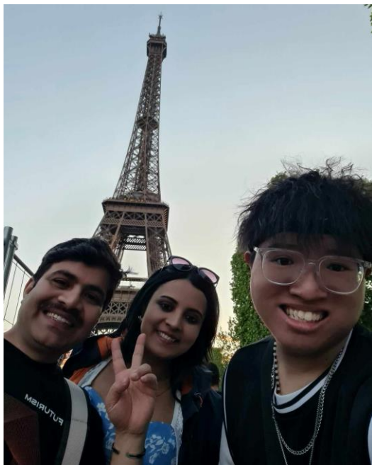
圖 10. 在法國巴黎結識的蘇格蘭小情侶