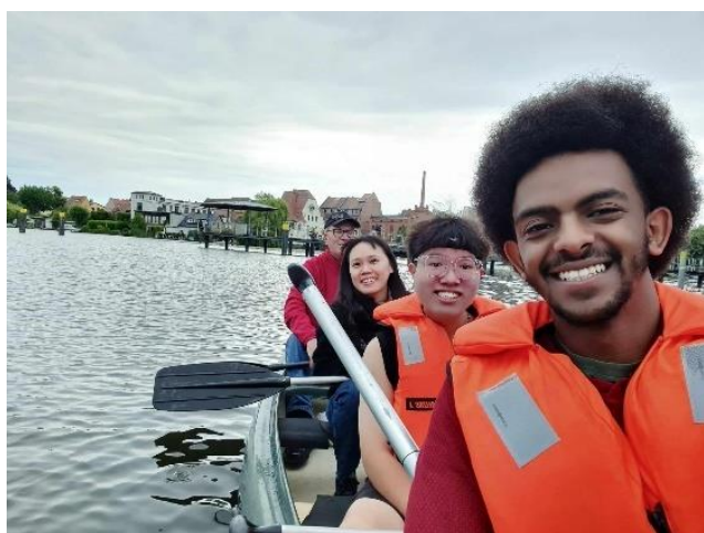
圖 4. 划獨木舟