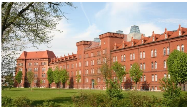
圖 1. 學校校園照

市，校門口也有一個電車站，側門還有一個隱藏的舊火車站，因此要去超市買東西或去布朗登堡總站也非常方便。