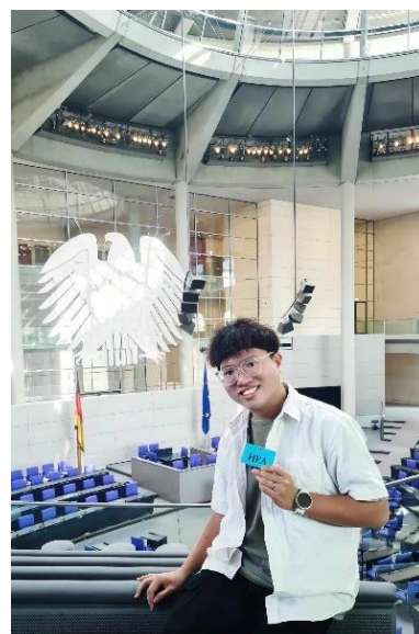
圖 5. 參觀德國柏林聯邦議院