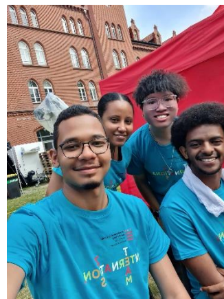
圖 9. 非洲國家的國際生