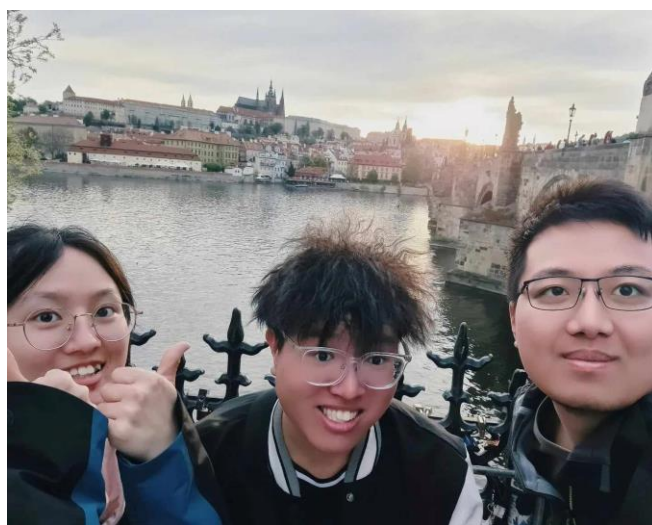
圖 12. 在捷克布拉格結識的兩位中國大陸交換生