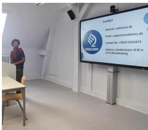
圖 6. 期末報告

德語教學（一堂兩小時每週上一堂），交換生英文教學（一學期只需要出席固定四堂課即可）。這堂是因為我的興趣和想增加其知識所以自己額外加選的選修課，相較於上面的課程會比較正式，和平常雲科上課沒什麼區別。但因為是以德語為主要教學語言，所以 Dr. Martin 會請交換生這學期只出席他規定的四堂課，那四堂會用英文教學。沒有期末考試但有期末報告，要求做出一個 PPT 然後 Presentation，寫出一份 Business Plan，還有拍一部宣傳片。而且格式內容要求蠻正式的，所以即使我們交換的這四個月只上四堂課但剩下的時間幾乎都在開會討論怎麼完成上面提到的那三份期末作業。但我從這堂課獲益良多，而且第一次和來自不同國家交換生們一起開會討論做報告這體驗真的很難得，因為大家都會互相分享自己國家所學習到知識然後運用到報告裡。