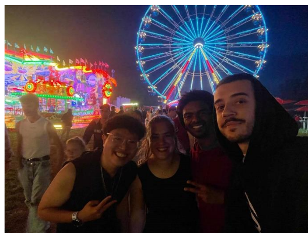
圖 14. 交換生們游樂園記

宿舍方面男女混搭四人同住，一人一間房很寬敞，房間的家具也很齊全，有共用的廚房，浴室還有一間廁所。我很幸運地遇到了很友善的室友們，大家都會照顧公共區域的整潔。另外廚房是我的私人愛地，因為我會每天固定