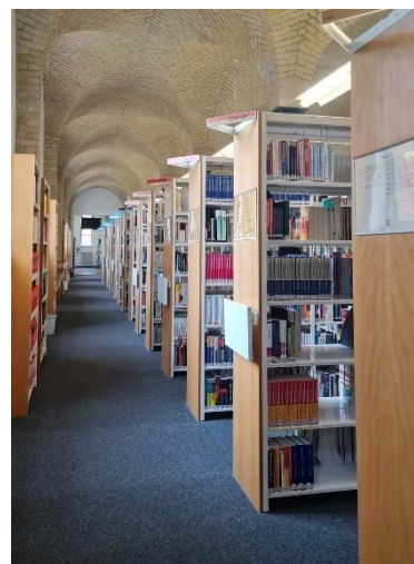
圖 2. 學校圖書館