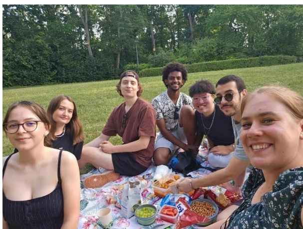
圖 13. 交換生們野餐記

雖然說同樣是認識“國際生”朋友們，但與我在台灣認識的不同之處就是，他們多數都是來自歐洲，非洲，土耳其，南美洲北美洲的同學。在交換之前我幾乎沒認識過任何一位來自上述國家的朋友們，都是來自亞洲的國際生們。生活，語言，文化的差異，卻反而是加深我們之間的感情的重要因素，大家都是第一次來德國，甚至也有和我一樣第一次踏入歐洲。我們真的是互相把彼此當家人一樣，在哪個遇到什麼有趣的新發現就會馬上通報分享，當某天大家共同都沒課時就會相約去柏林或其它德國城市逛逛，野餐，甚至到其中一人的宿舍聊天到半夜，到天亮。也許沒有任何目的地或計劃，但這就是屬於我們歡樂的日常，最值得珍惜的日子。這次來德國交換更幸運碰到了德國為當屆東道主的“2024 歐盟杯”，還有在法國巴黎舉辦的“2024 巴黎奧運會”。歐盟杯比賽的那兩個月，學校都會有現場直播邀請學生與附近的居民一起來為德國隊加油（甚至期末考月還和我們說先支持德國隊比較重要），我們男人們幾乎每一場都有參與，猜那場誰會是贏家，有空相約一起相聚看球，甚至其中土耳其和波蘭也有在比賽中，能看到我的朋友們為自己國家盡全力加油的誇張姿態。這是我人生中第一次那麼關切球賽，直到決賽西班牙的勝利，我才自覺屬於我們男人的快樂突然間沒了。