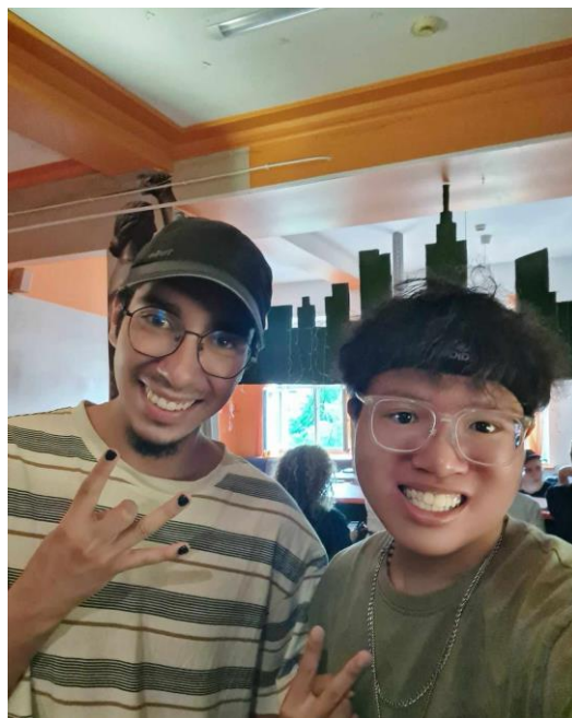
圖 11. 在波蘭華沙結識的哥倫比亞大哥