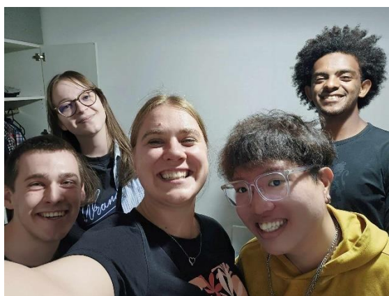
圖 19. 離別前夕(I)