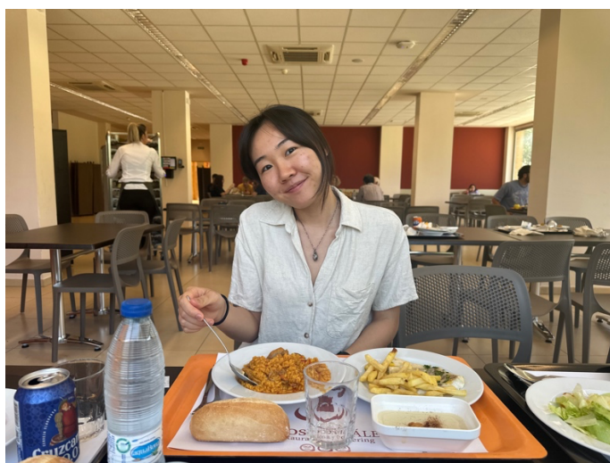
（圖九）哈恩大學有每日不同餐點的學餐，價格相較外面算學生友善，有兩道主食，一份甜點，一塊麵包，飲料任選，而且很好吃。