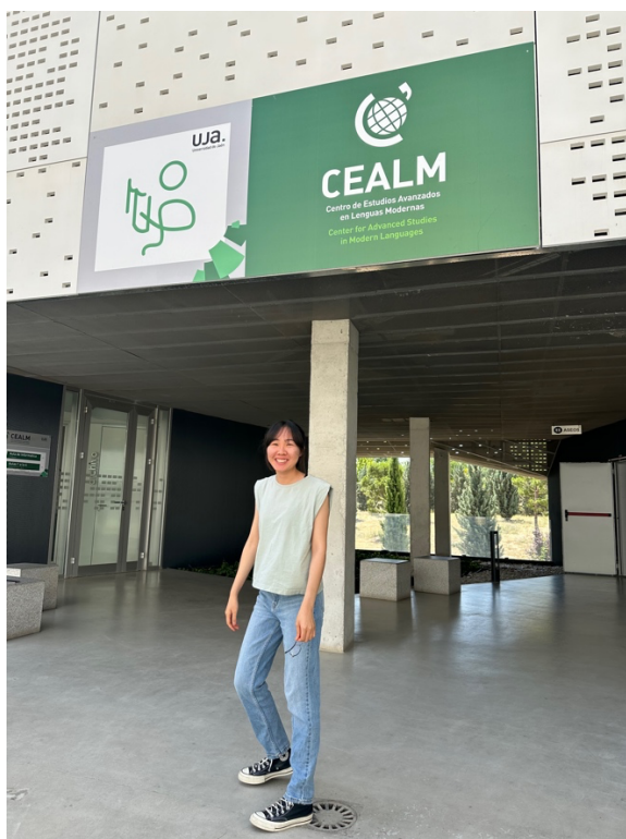
（圖八）學校有兩個學區，此為語言學區，會看到交換生來來去去，這裡也是學生宿舍以及學校健身房的區域。