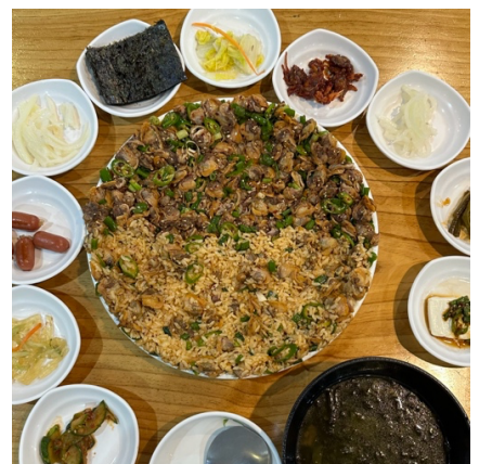
↑ 江陵：BTS 春日車站(左)、必吃豆腐冰淇淋(中)、毛蚶拌飯(右)