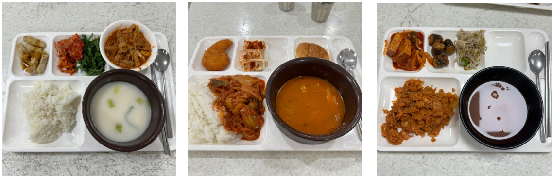
↑ 學餐菜色(僅供參考)，每餐為₩5400(約$127)，相較外食已經便宜許多。