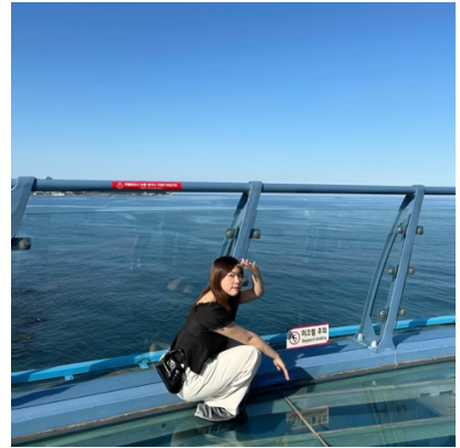
↑ 釜山：膠囊列車(左)、海雲臺沙灘(中)、松亭天空步道(右)