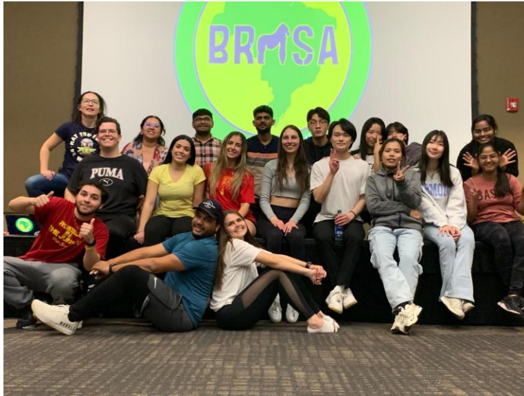
巴西學生會舉辦的 fit dance 活動