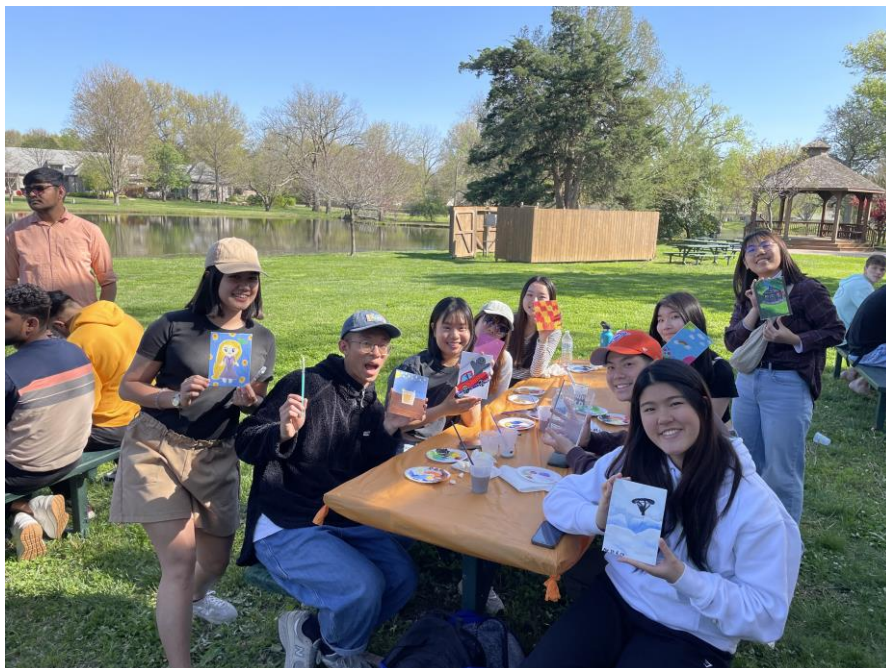
學校國際事務處舉辦的畫畫活動