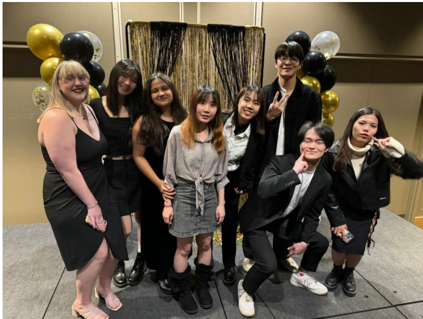
Black student association 舉辦的舞會活動