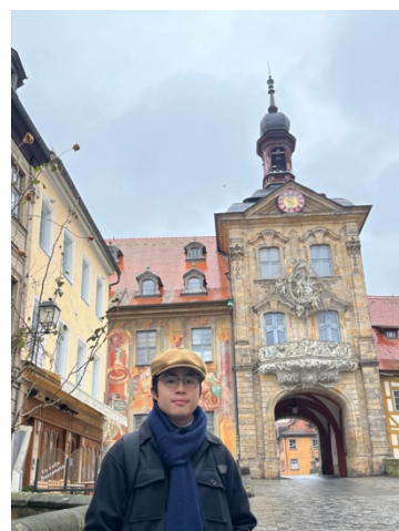
聯合國文化遺址城市-德國班堡

除了在學校的學習，我也常常把握時間出門到戶外旅遊，趁著地理優勢之便，到附近的國家看看。『讀萬卷書，不如行萬里路』這一佳句非常適合形容我這次的體悟，我除了到英國、荷蘭、瑞士、義大利、奧地利、法國、梵蒂岡等國，更是利用了德國境內的49歐月票去了德國境內的多個城市，體驗德國城市雖然相似，卻又大不相同的感覺，並了解當地的歷史、地理與文化。