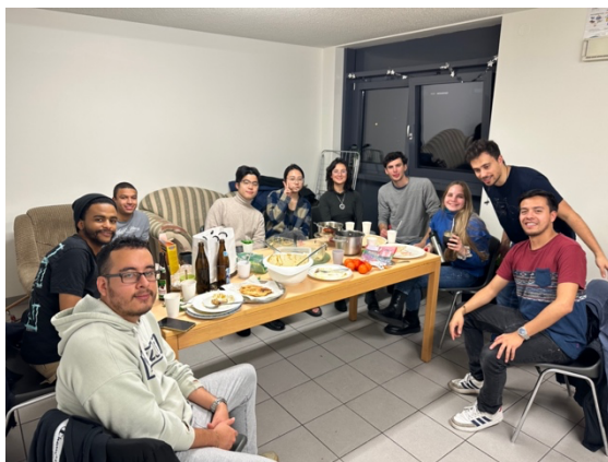
與國際生交流的餐會

最後，透過這次的交換，我有幸結交了許多來自不同國家的朋友，這是我第一次有機會和來自各國的同學共同交流，彼此了解對方的文化，向他們介紹台灣。我們在廚房裡一起烹飪，分享彼此家鄉的美食，這真的讓我體驗到了許多以前未曾有過的經歷。而且我們之間的交流並沒有停止，我們在社交媒體上繼續保持著聯繫。