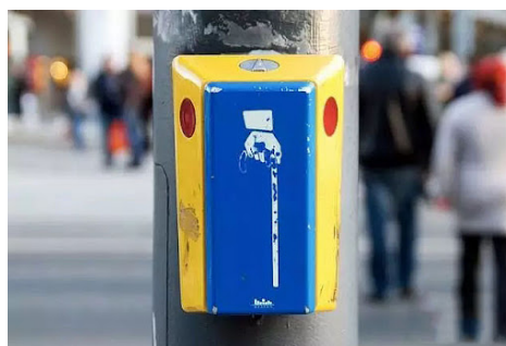
德國幾乎每個斑馬線都有行人過馬路按鈕，增加安全性

在德國的交換學習中，我體驗到了大部分人對於禮讓行人的素質。在德國的道路設計方面，我發現與台灣相比，德國的道路設計優良許多。首先，德國的人行道寬敞舒適，給行人提供了更安全、更舒適的步行空間。斑馬線設計也更為完善，包括有行人庇護島、行人過馬路按鈕、長度較短，增加行人的安全性，不僅在道路設計上更科學，也擁有相對充足的通行時間，大部分司機也會積極讓行人優先通行，較不會以車逼人。