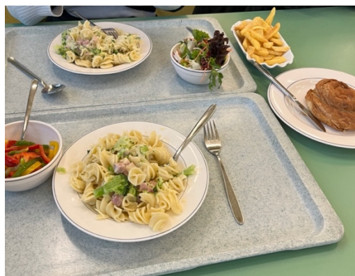
學餐的 3.2 歐元餐點套餐（麵與沙拉）

學校有一間學生餐廳坐落於 Moltkestraße 餐點有義大利麵（如左圖）奧地利豬排、薯條與咖哩香腸等套餐。而校內也有咖啡廳供學生於平日使用。學校周圍就是 Europaplatz（歐洲廣場，幾乎在德國每個城市都有一個這樣的地方），在這邊有很多餐廳跟超市，我通常下課後會在這邊購買生鮮雜貨回宿舍廚房料理，使我廚藝進步很多。