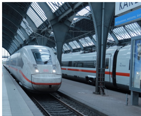
德鐵非常舒適卻也常常罷工

讓我印象深刻的一次經歷是當我們需要處理德鐵（DB）的延誤退款問題。德鐵的退款系統出現了一些問題，導致我們一直未收到任何退款。於是，我們決定致電德鐵，希望能夠解決這個問題並獲得退款。我與接線人員溝通時，儘管我的德文還不夠流利，但他們最後仍然成功理解了我們的訴求，最終也順利地完成了退款流程！這次經歷讓我感到非常自豪，也更加堅定了我提升德文能力的決心。