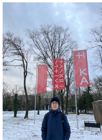
我與 HKA 校園的合照

卡爾斯魯厄應用科技大學（Hochschule Karlsruhe, HKA）所在的城市卡爾斯魯厄交通很方便，基礎建設極度完善，鄰近法國和瑞士，更是該邦（巴登符騰堡）的第二大城，僅次於斯圖加特。該城市內還有很多其他學校，如德國頂尖大學卡爾斯魯厄理工學院（KIT）、教育大學（就在 HKA 旁邊）、州立大學與音樂學院等。德國境內校園的圖書館都是大家都可以使用的，資源達到很平等的分配。有時候我也會到各地圖書館探訪、學習，善用各校資源。