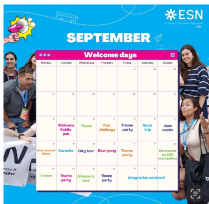
學校 ESN 舉辦的活動時刻表