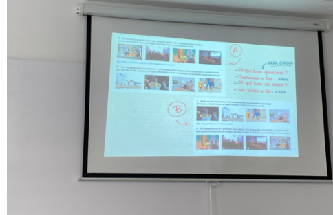
參加學校合作旅行社北部西班牙之旅