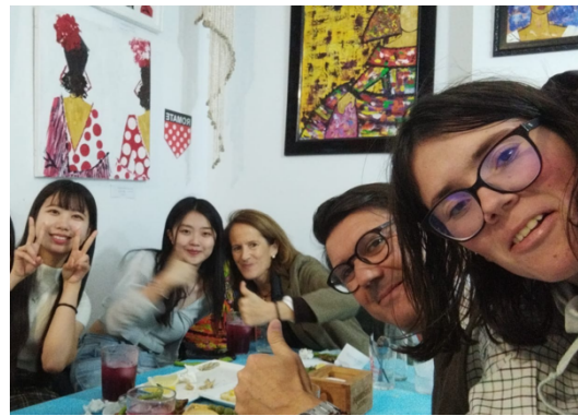
獨旅嘗試使用西班牙文認識朋友