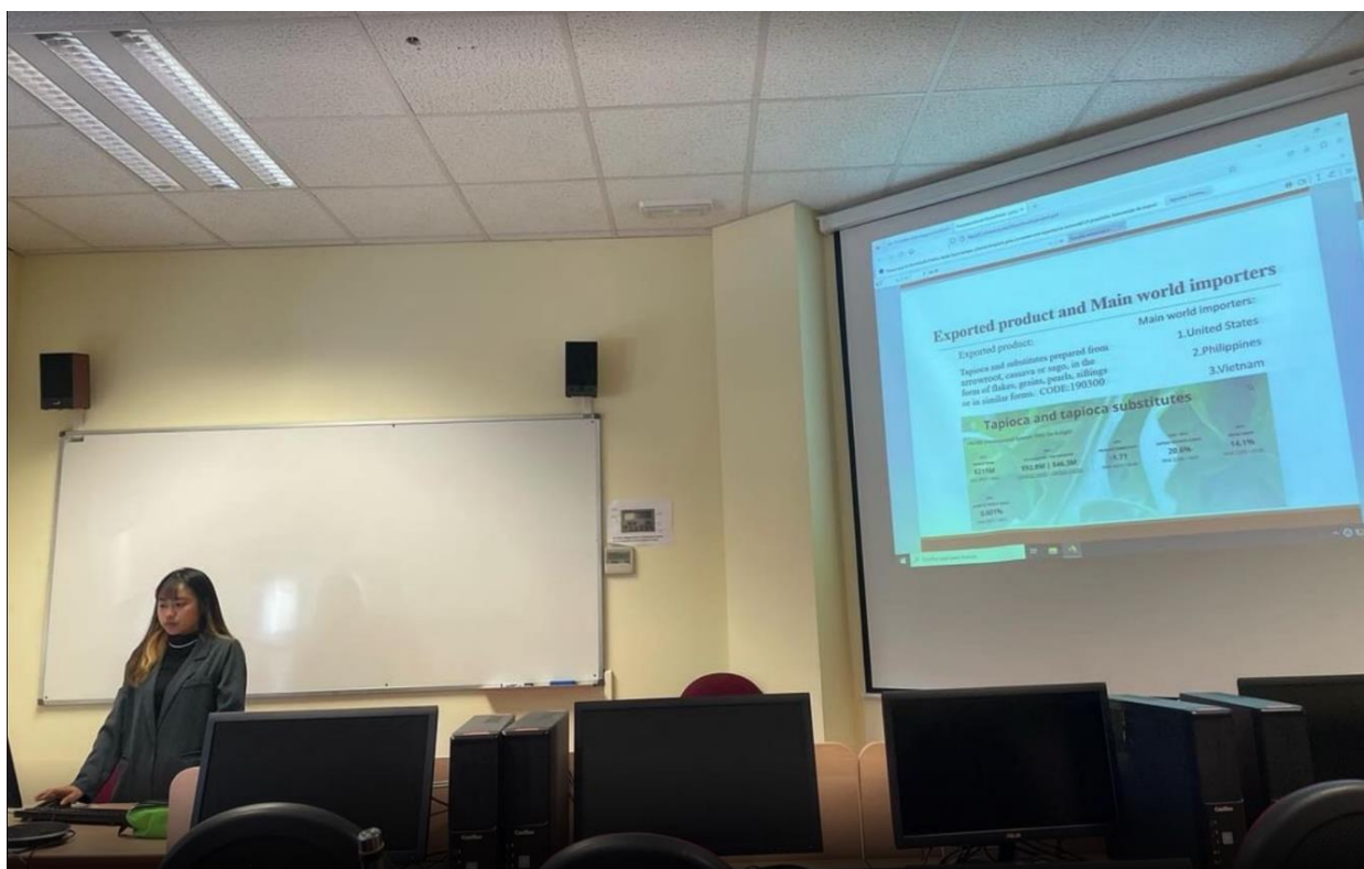
附圖為期末上台報告

國際經濟是我所在的系所開給交換生的專業課，會分成兩天上課，有實作跟理論，我上的課的老師的教法偏向於讓學生自由發想，所以大部分是上課半小時然後接下來是問題討論跟國際事項探討，考核方式除了期中期末各有一次考試外，最後還有一個英文 project ，必須要調查各自國家的經濟概況然後上台報告，老師會提供可查詢公開資訊的網站！