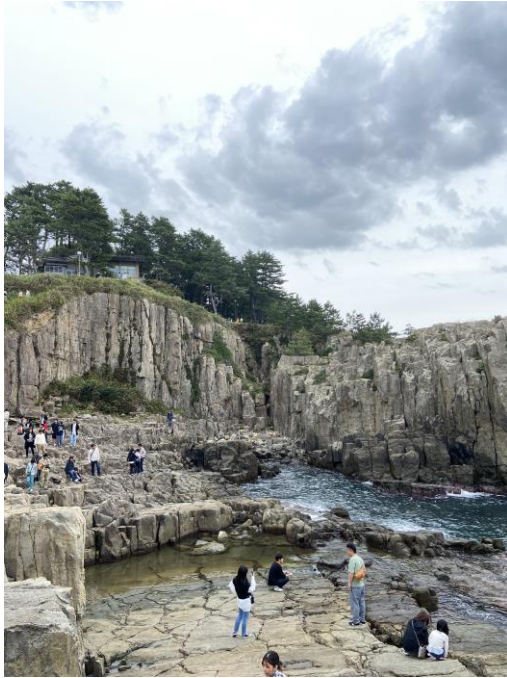
▽ 東尋坊（とうじんぼう）