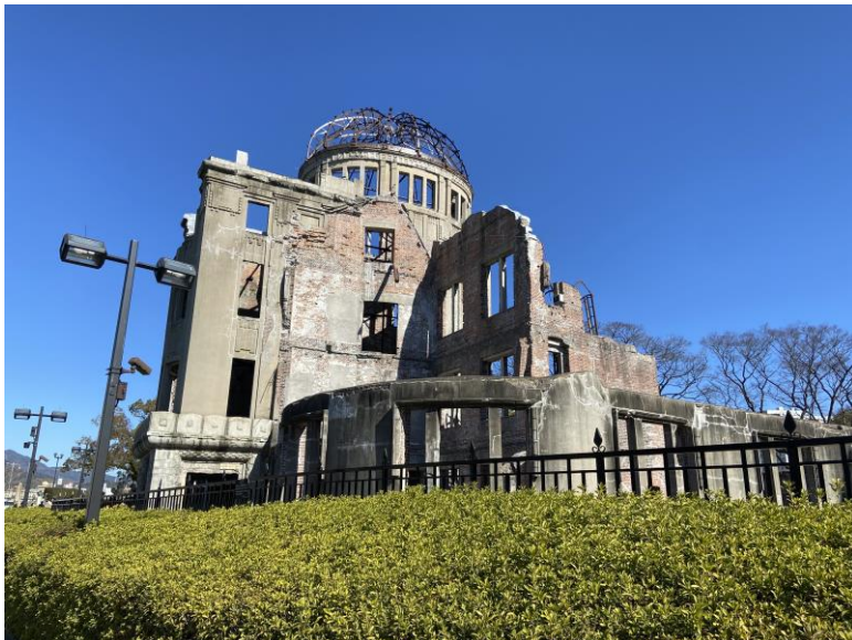
▽ 原爆圓頂館（げんばくドーム）