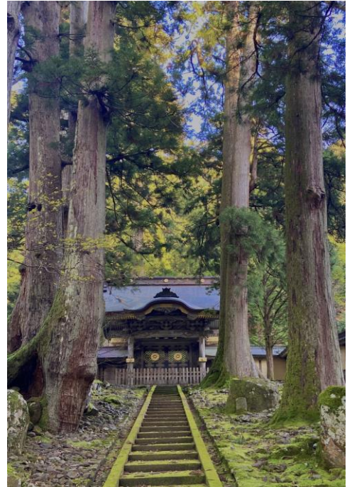
▽ 永平寺（えいへいじ）