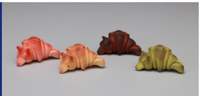
前期課程製作的作品—クロワンちゃん