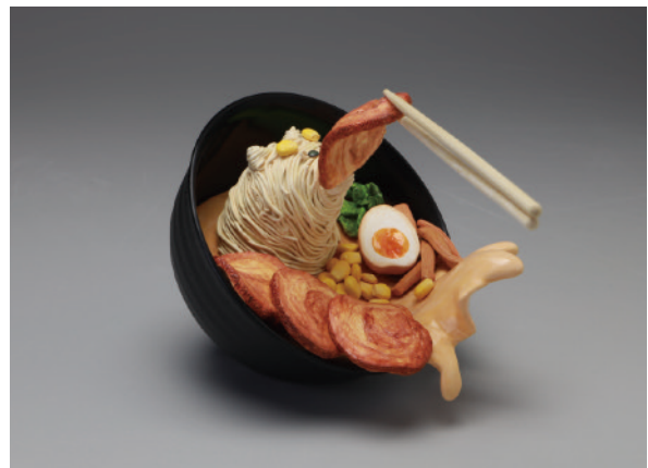
參與學校芸工祭展覽所製作的作品—ラーメン泥棒

不僅透過模型公仔與雕塑的課程所習得的技術，能讓我運用在文資專業上，在課外之餘也實際走訪了許多的博物館、美術館與文資景點，而對於博物館展示、文資經營有了更寬廣的想像，也經常參與校內所舉辦的交流活動，讓國際視野更加的廣闊。