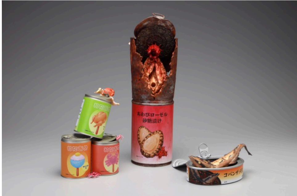
後期課程製作的作品—思い出缶詰