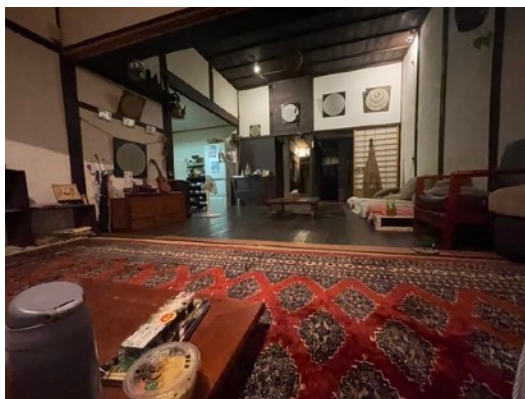
於萩市時居住的古民家