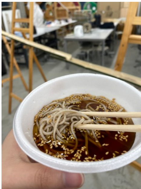
參與聖誕流水蕎麥麵活動