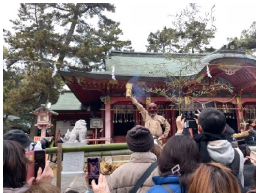
長田神社古式追儺式・節分祭