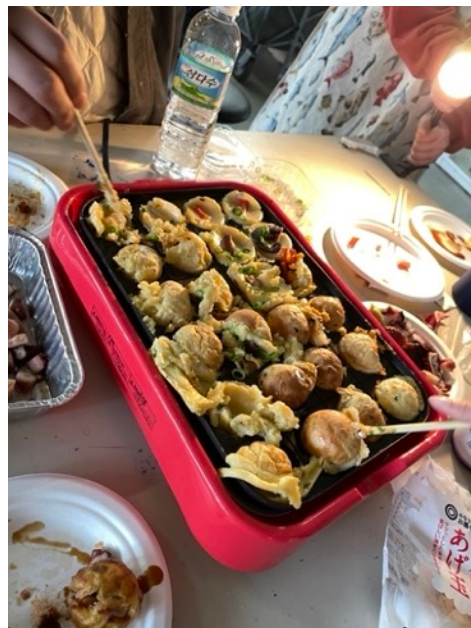
交換禮物兼章魚燒派對