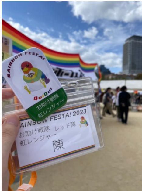
到大阪擔任兩日的彩虹遊行志工