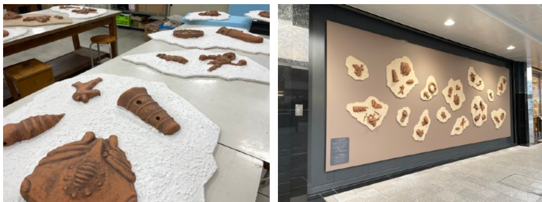
參與パネルアートプロジェクト

很高興能透過這個機會到國外的學校交換就讀，而獲得了非常多寶貴的經驗。課程方面，系上老師總是非常溫柔、仔細的回應我所提出的疑問，讓我在交換期間養成了有任何不懂的地方，就會去尋求幫助的習慣，才因此能學會多年來一直想學習的矽膠翻模、3D建模與列印的技術，而這樣的習慣相信也能在未來派上用場。另外，老師們也總是非常尊重學生們的想法，依據作品給出具體的評語，讓人能清楚知道有哪些地方可以再多加思考，又有哪些部分可以再改進，讓人能放心又大膽的嘗試自己想製作的內容。