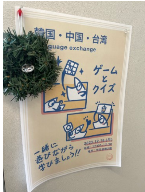
擔任主辦場語言交換活動海報繪製