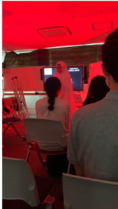
（舉辦各國特色活動---鬼故事）

怕自己語言不好，不敢搭話的情況下，非常建議大家到這裡去做交流，因為會有各項活動，讓你有機會認識他們，也可認識更多不同國家的人。每週也都會根據不同的主題舉辦午餐對話，可以讓自己多多開口學習日文與英文。