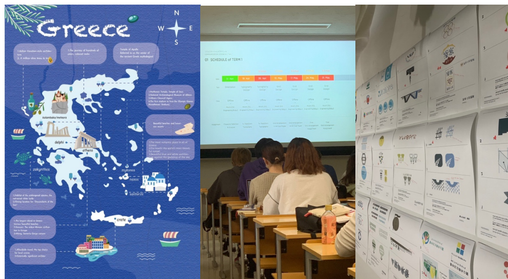
(課堂作業與上課模式)