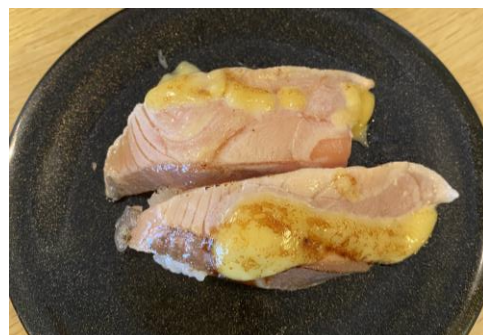
▲ 宿舍附近好吃的壽司店-魚心