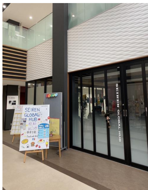
▲ Global Hub

國際地域系專注於培養能夠整合研究並處理福井在地、日本甚至是全球相關的各種議題，推動國際社會建設與發展的人才。我上課的教室都在「學生交流センター」這棟福井大學裡最新的建築物裡，國際課也在這裡的一樓。此外一樓還有「Global Hub」的交流空間，會不定期舉辦萬聖節、聖誕節等等的活動，平時開放的時候也可以在那看書、交朋友。它的正對面也有可以讀書的空間，但要注意不能飲食。