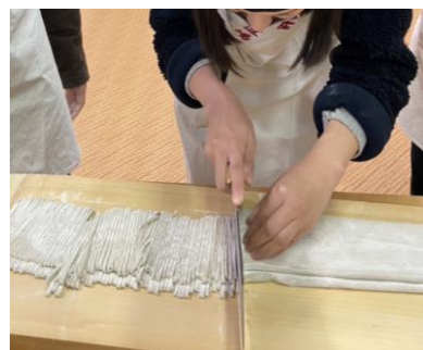
▲ 蕎麥麵 DIY

的工廠參觀，基本上都是用日文導覽，然後回去一周內要交一篇心得報告。但這堂課只開給 Program A 的人，所以我覺得很幸運能有機會認識福井厲害的傳統產業，而且每次參訪都會安排手作體驗活動還可以帶自己做的東西回去！建議在參訪時可以多拍照片放報告裡，順便留作紀念。