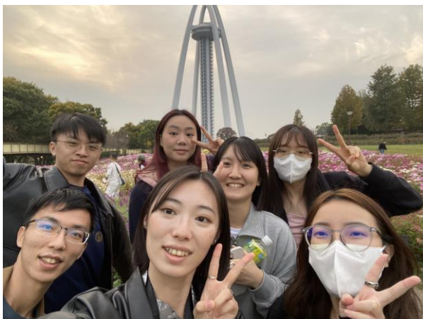
▲ 在福井大學交到的朋友們

最後，我覺得自己很幸運在交換期間認識了許多很棒的人，感謝大家讓我的留學生活增添了色彩！雖然很多人去交換一定會想要盡情玩，但日本很注重出席，既然都選擇去交換了還是好好地學習，在課堂上一定會有不少收穫的。然後放假時再跟朋友們到處探索，享受這得來不易的留學生活。很慶幸自己結交到很好的旅伴及朋友，讓每次的旅遊都變成令我永生難忘的寶貴回憶！