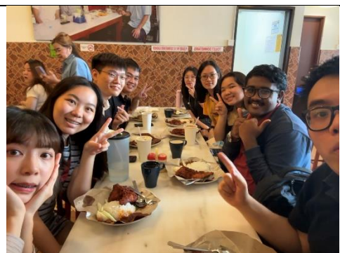
與大馬同學一起到 吉隆坡知名椰漿飯慶祝第一名