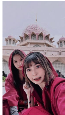
與杭州交換生一起去參觀 粉紅清真寺