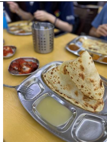
品嚐 MAMA 檔的特色美食 Roti Tissue