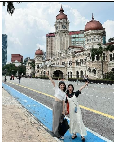
與日本室友到獨立廣場打卡