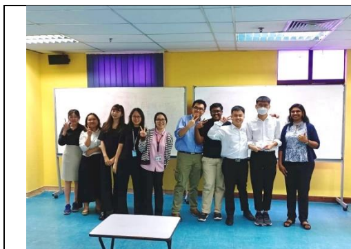
Choral Speaking Competition 第一名