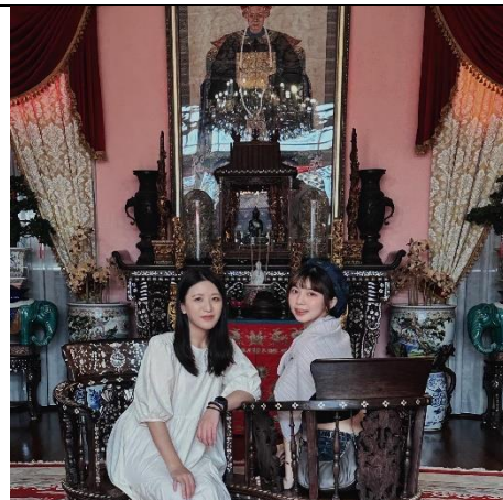
與雲科學姐到檳城三日遊