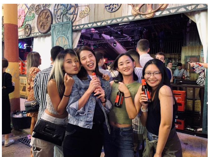
Feria de San Lucas 2022 Jaén