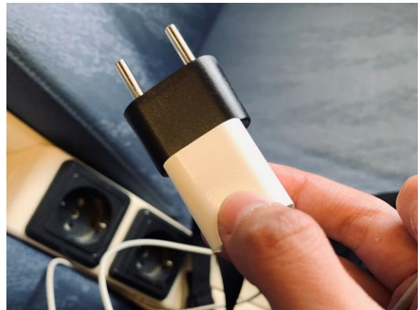
歐規兩腳圓形轉接頭