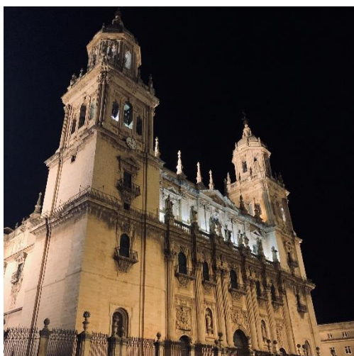
Catedral de Jaén

觀禮西班牙節日和慶典也是一種獨特的體驗，在Malaga旅遊時，我觀賞到傳統的聖周活動，感受到了宗教的神聖魅力。此外，Sevilla廣場的弗拉明戈舞的表演和舞會也讓我深深愛上了這個熱情的國家。