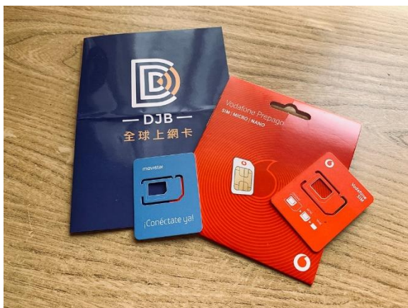
短期旅遊網卡及儲值網卡

另外補充，目前3C產品，如電腦、手機、相機等的充電器都有內建變壓功能，是不需要準備變壓器的。但像是 吹風機、離子夾、捲髮器 這類電器產品 要注意是否適用220V的電壓 ，如果在沒有變壓器的不當使用情況下通通都會燒掉，嚴重可能產生爆炸，要特別留意是否須購買變壓器或購買支援220V電壓的美髮產品。