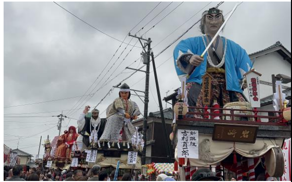
五月三國神社三國祭