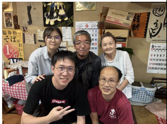
在乾德亭裡結下的因緣