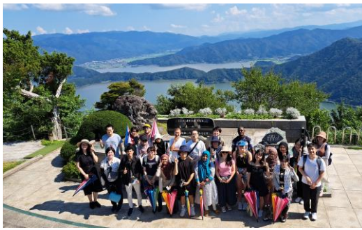
彩虹之路山頂公園