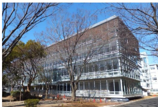
千葉大學-西千葉校區

千葉大學建校於 1949 年，是位於千葉縣千葉市的一所著名研究型國立綜合大學。千葉大學擁有十個學部，其中國際教養、法政經、園藝和看護的四個學部是在日本國立大學之中唯有千葉大學有的學部。千葉大學也是日本文部科學省指定的『超級國際化大學計畫』投資的一流大學，有眾多的海外留學生，且設有 English House 國際交流設施，留學制度也相當充實。