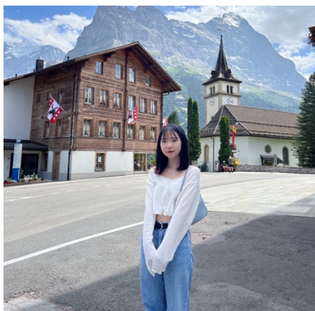
圖 6. 瑞士最美小鎮-格林德瓦

現在認真想想，我真的很慶幸自己有選擇在這學期出國交換，也很感謝身旁的家人、朋友、老師們的鼓勵，讓我有勇氣踏出這一步去感受世界的遼闊。這半年的學習不僅提高了我的德語和英語水平，增加了我與當地人交流的信心，也開拓了我的國際視野，也算是為我四年的大學生活劃下了完美的句點。