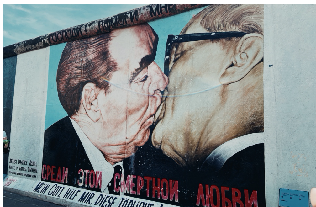
圖 1. 東邊畫廊著名的「兄弟之吻」

不過說實話，我覺得我也算是誤打誤撞來到德國的，因為我一開始是規劃在大四上學期透過 UMAP 申請日本或韓國的學校，不料那時候剛好碰上第二波疫情爆發，很多日本或韓國的學校沒有開缺額，所以我就決定放棄原本申請上的 UMAP，等下學期重新申請一次海外交換並跟我的好朋友一起來到德國。