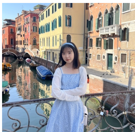
圖 5. 在義大利的水都威尼斯