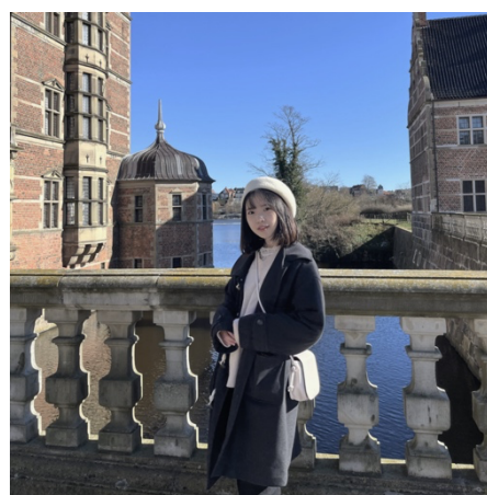
圖 4. 在丹麥斐特烈堡的照片