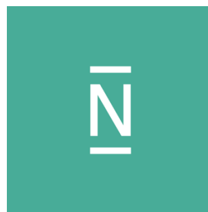
圖 7. 虛擬銀行 N26