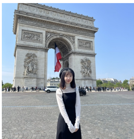
圖 3. 在凱旋門前拍照

這一趟來德國我總共待了五個月左右，因為我的課程基本上都集中安排在星期二和星期三，所以剩下的時間我可以和朋友們一起去參加各種活動、暢遊德國、和到歐洲各國旅行。在交換期間，我總共去了 10 個國家，除了德國之外，還另外去了丹麥、捷克、匈牙利、英國、法國、波蘭、義大利、凡蒂岡、瑞士。