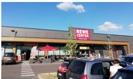
▲【最常最愛逛的超市 REWE】