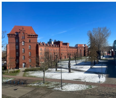
▲【學校春天及冬天的樣貌】