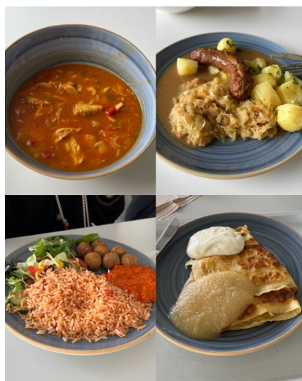
▲【學餐 一份1~3.5 歐不等】