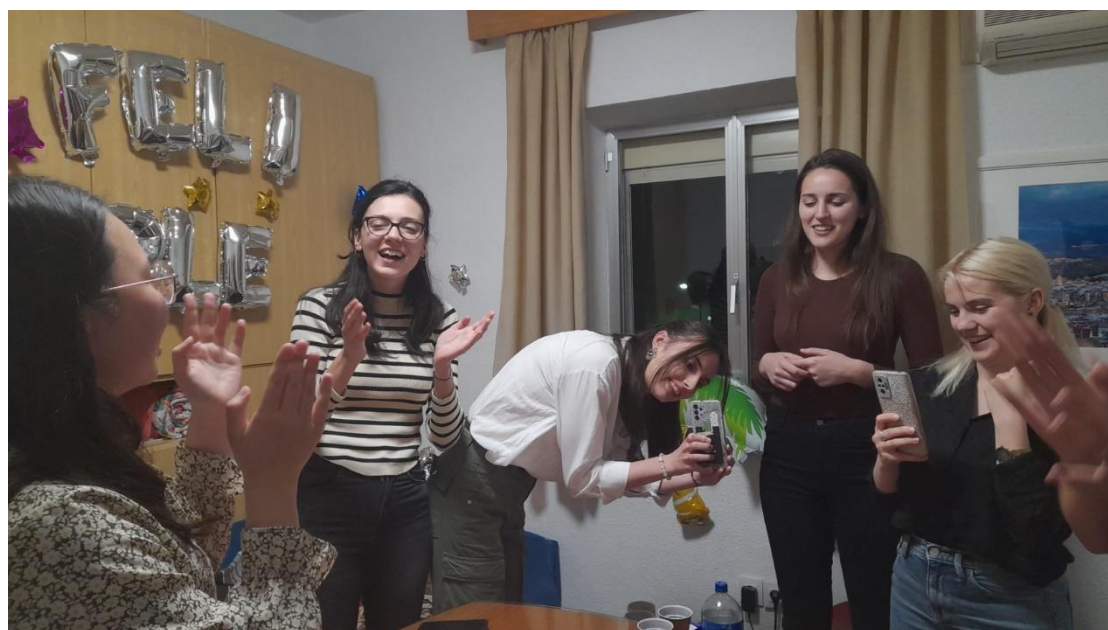
來自不同國家的朋友聚在一起為室友慶祝生日

而不在哈恩的日子就是出門旅行，交換期間走訪了歐洲大部分國家，有些是和室友一起，有些是自己獨旅，有些是和家人一起。也去了一直非常嚮往的英國，去拜訪了我最喜歡的哈利波特片場，也去了艾菲爾鐵塔、馬特洪峰，以及好多好多從前只能在書本上抑或是手機上看到的建築、景色。