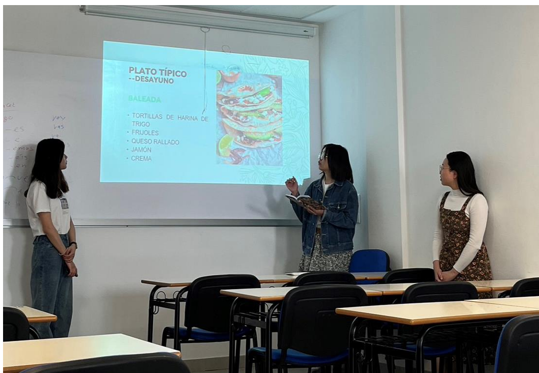
Oral 1 期中分組上台報告

評量方式的話，A1.1 沒有期中考試，期末考則是紙筆考試。Oral 1 在期中時會讓大家 分組 上台報告別的西語系國家，而在期末時是 個別 上台報告介紹西班牙的某個城市。雖說全西語口說報告聽起來很可怕，但其實都是可以帶講稿上台的，老師也會仔細聽你報告，所以考前充足練習就不用擔心了。