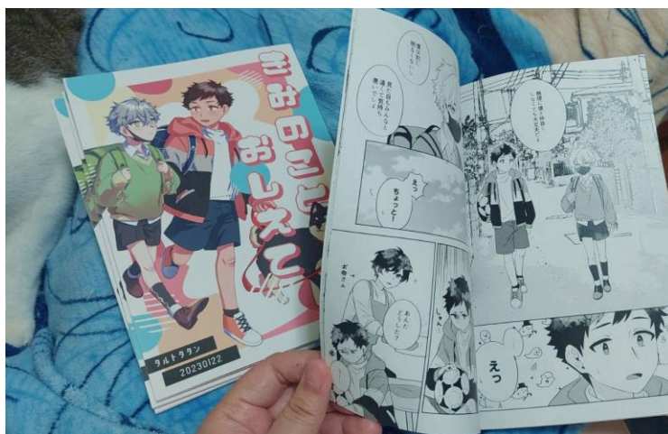
（圖 1 課堂作業的漫畫作品）

在這半年的留學期間，為了完成漫畫表現科的課程作業，我繪製了一本漫畫作品。這本漫畫是我在神戶期間的總結和創作，它不僅是我在學習和實踐中的成果，也是我對這段留學經歷的回憶和紀念。完成這本漫畫讓我更加自信和有信心地迎接未來的挑戰。