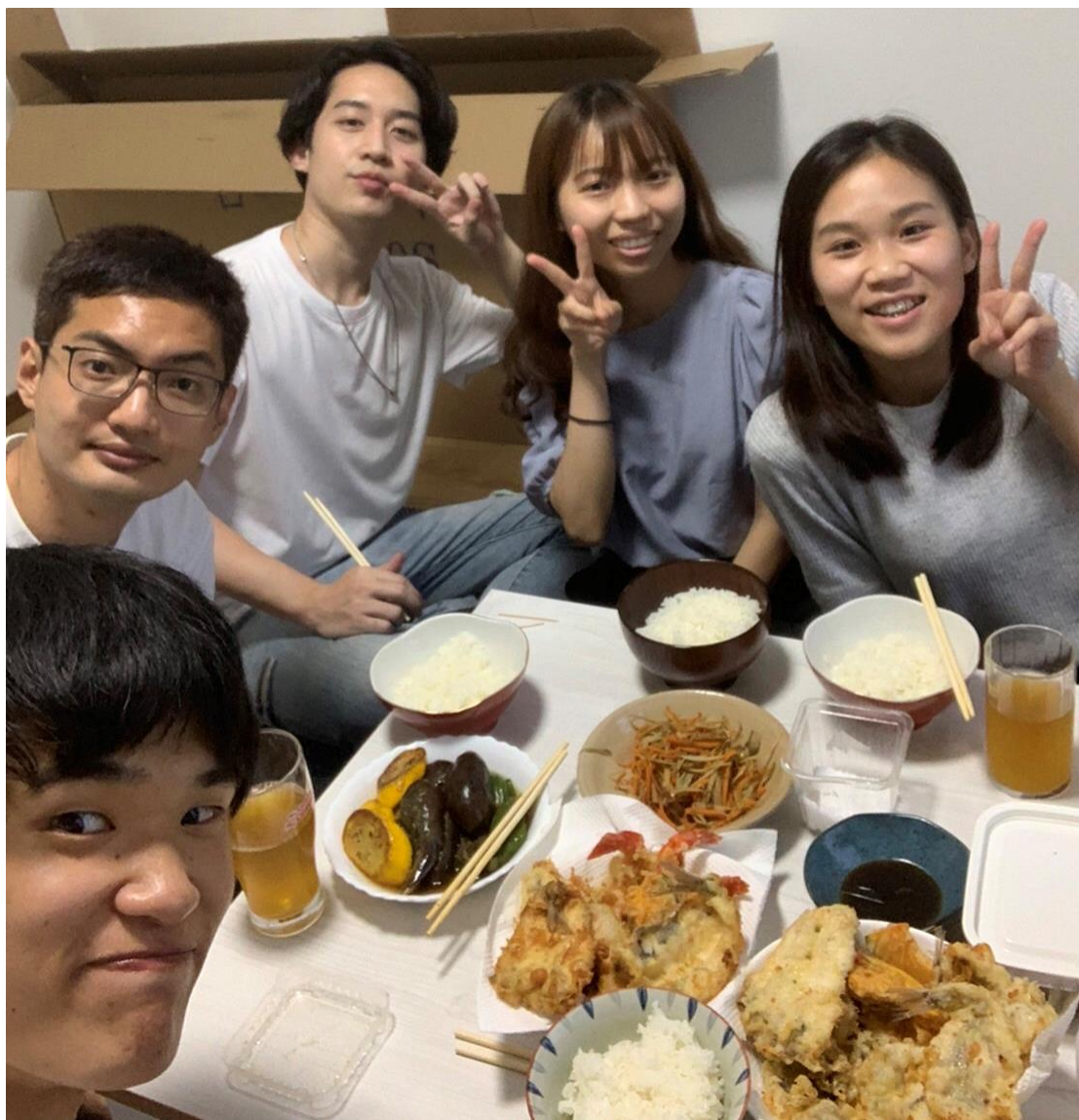
到日本朋友家品嚐日本家庭料理(1)