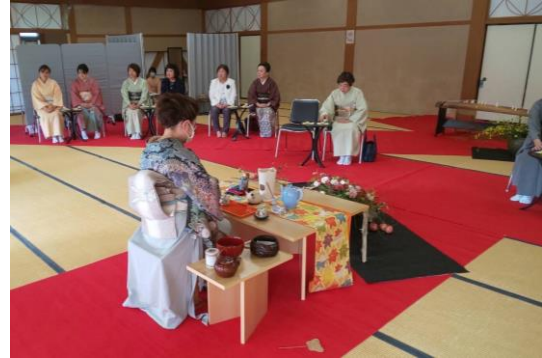
觀賞古箏及茶道表演