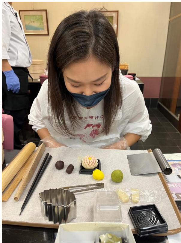
京都體驗手做和菓子