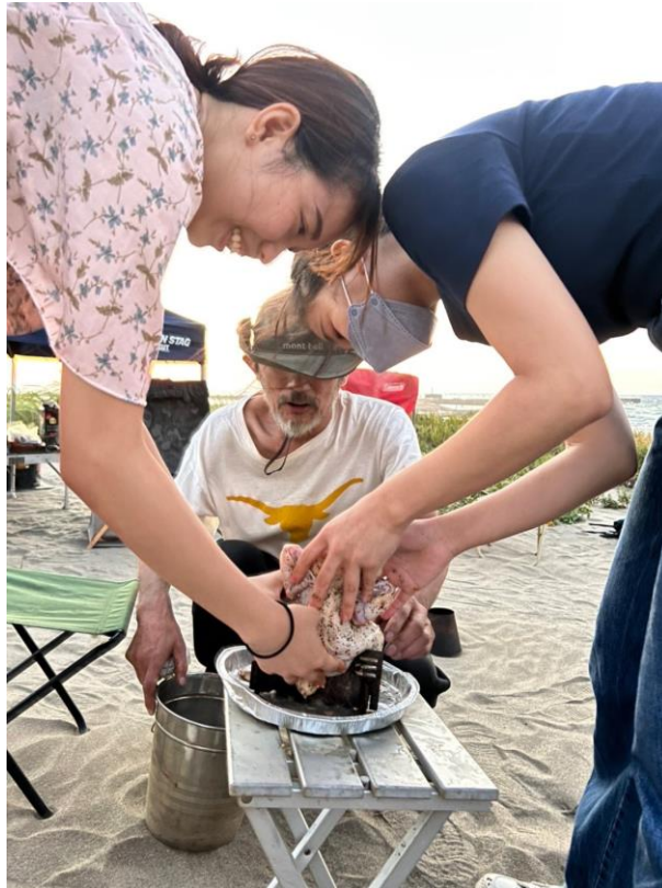
中秋節在海邊吃烤雞