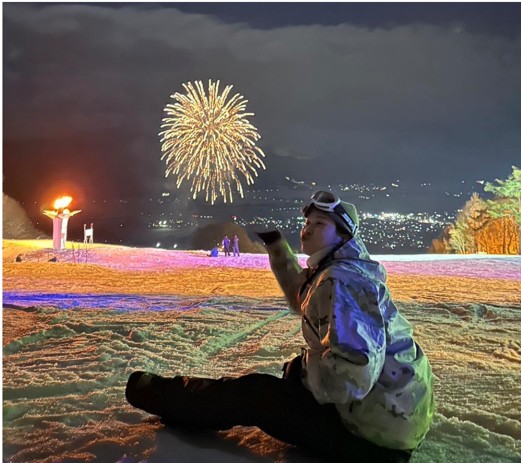
冬天滑雪看煙火秀