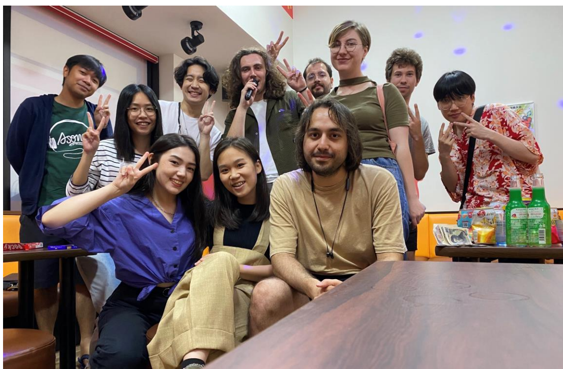
留學生 karaoke & birthday party