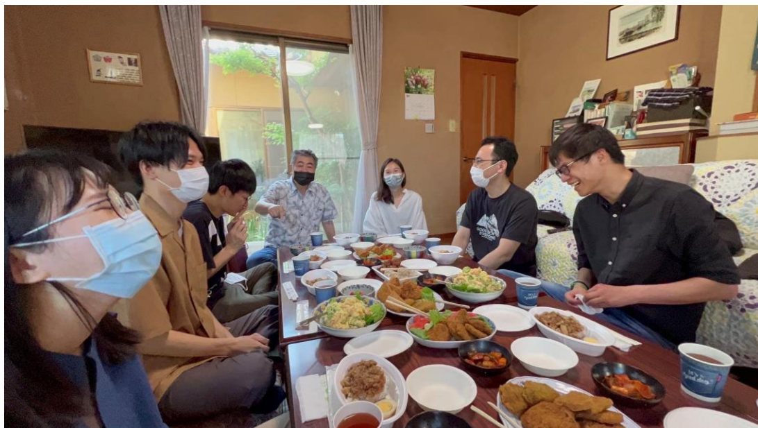
與日本老師和台灣留學生聚餐