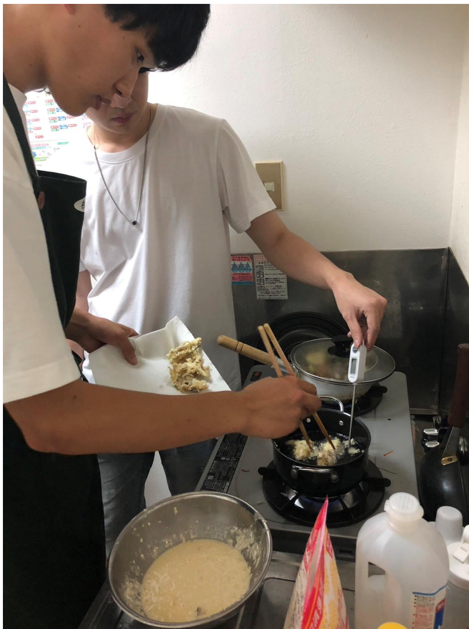
到日本朋友家品嚐日本家庭料理(2)