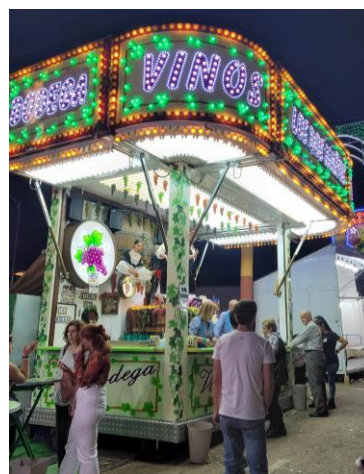
圖 6. 一年一度的哈恩慶典-Feria