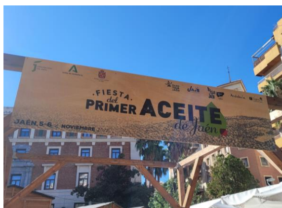
圖 5. 哈恩的橄欖油節