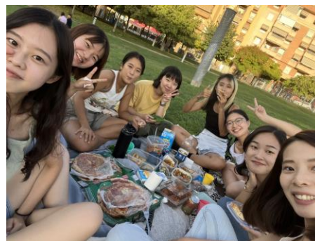
圖 8. 到公園野餐

我覺得交換期間學到最多的是如何與人相處，踏出原有的舒適圈，每天都期待能夠與新朋友交流，大家都來自不同國家，聚集在同一個地方交換，這段緣份是難能可貴的，所以大家皆抱持著開放的態度互動，珍惜著僅有半年的時間過著每一天。