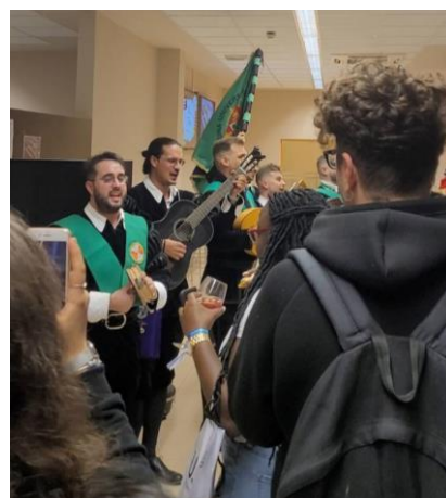
圖 4. 國際學生歡迎會