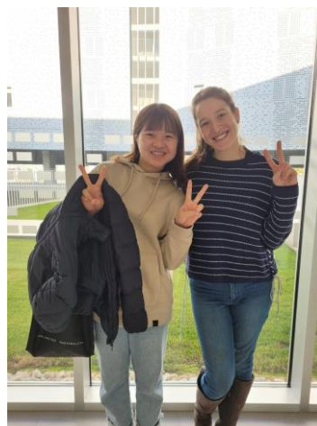
圖 2. 與西班牙語課老師合照