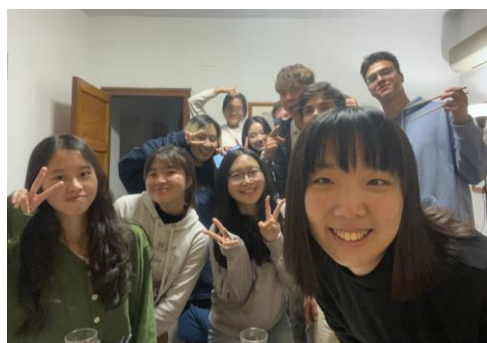
圖 7. 與波蘭朋友們分享亞洲料理