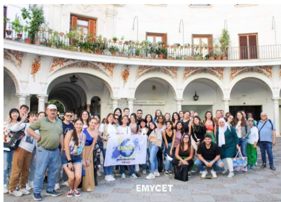
圖 3. 參加 Emycet 旅行團

交換期間，除了學校課業要兼顧外，結交各國朋友也是非常重要的一環，我建議能夠多參與由歐洲學生會組織 ESN 舉辦的活動，他們會定期舉辦到西、葡各地的小旅行，相比自由行，能夠省下不少錢，更能認識到更多人。