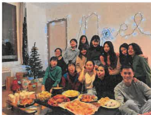
圖 11. 與雲科交換生在法國聚會