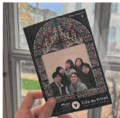
圖 12. 國管們大集合