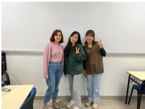
圖 1. 與西班牙語課老師合照

其中令我印象很深刻的一項功課，老師要我們去當地的傳統市場跟店家練習口說，我覺得把課本的內容應用於實際，理解上會更有概念。