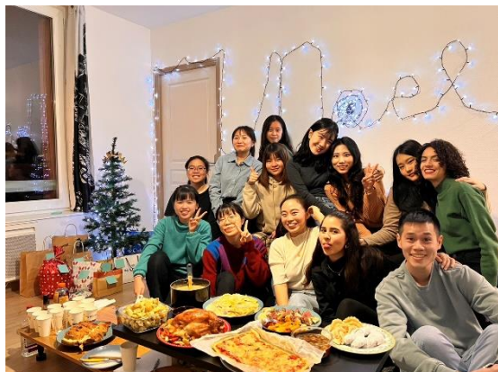
▲與學伴、各國交換生聚會