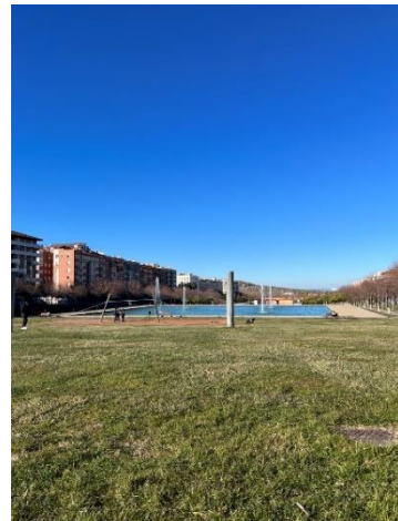
▲ 哈恩主教堂、哈恩跳蚤市集、哈恩 Bulevar 公園