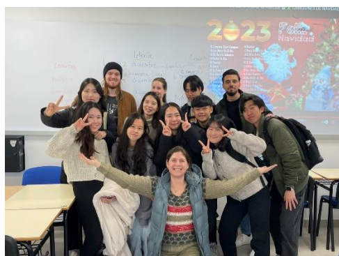
▲語言課上課情形、課堂老師同學合影