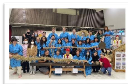
■ 沖繩文化課-與那原拔河