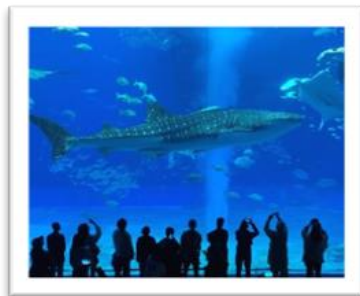
▣ 沖繩美麗海水族館