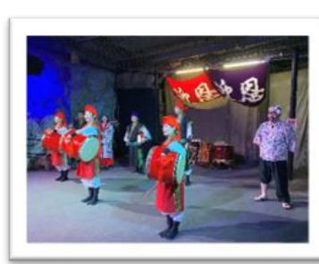
▣ EISA 太鼓舞