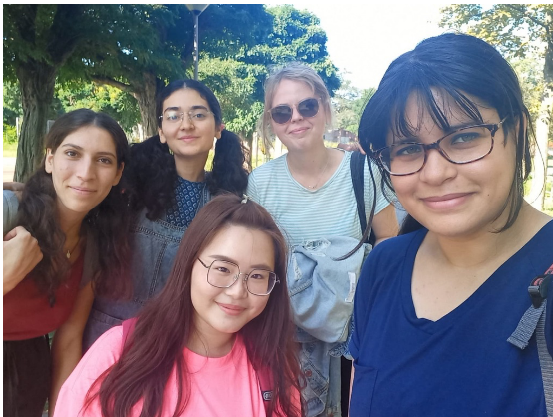
與交換生一起參與國際處舉辦的活動