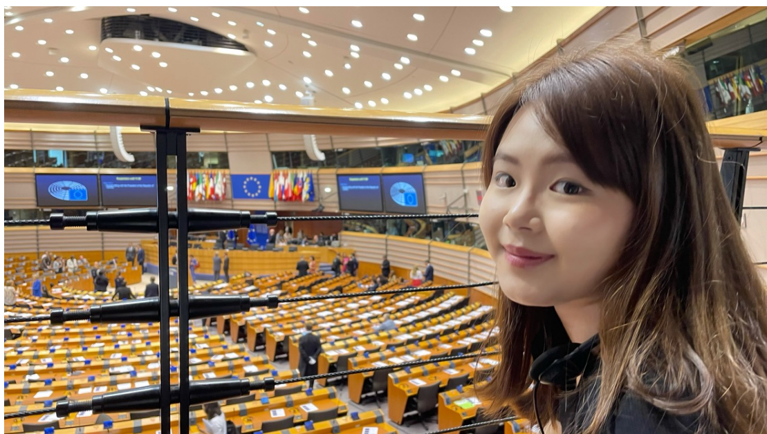
至歐盟議會校外參訪