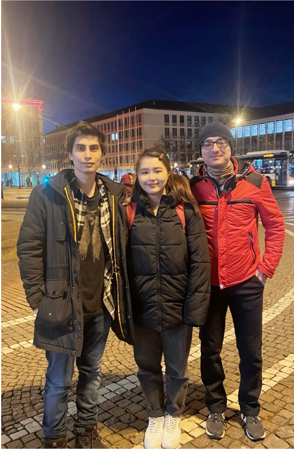
與同系交換生一起聚餐