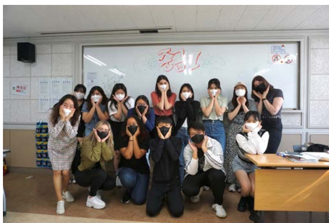
(圖 9)語學堂 3 級結業式。與同學老師合影。