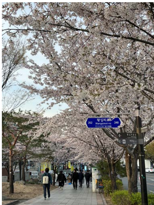
(圖 1)四月開滿櫻花的首爾。