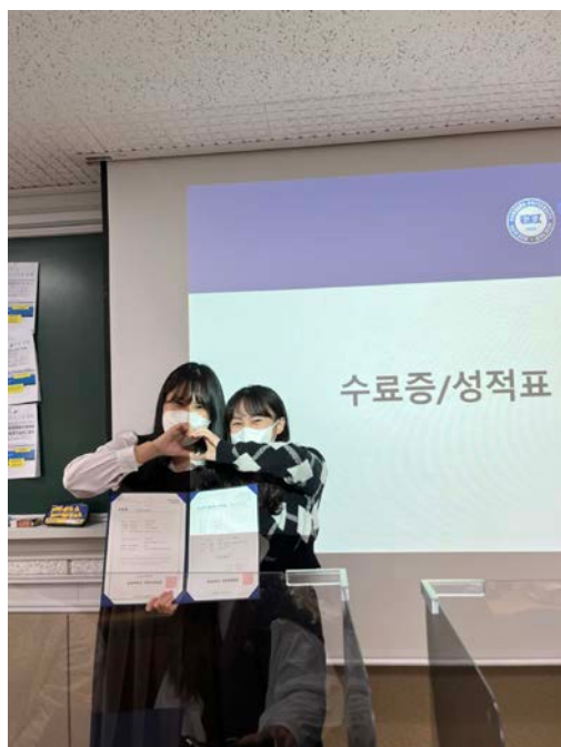
(圖 11)語學堂 4 級結業式。頒發結業證明與成績單。