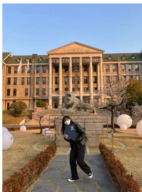
(圖 12)語學堂 4 級結業式。與學校雕像合影。