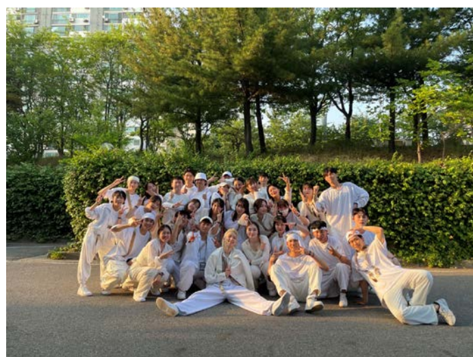
(圖 6)Morelib 活動演出-首爾 THE UNION 活動公演