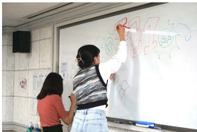
(圖 8)語學堂 3 級結業式。幫忙佈置。