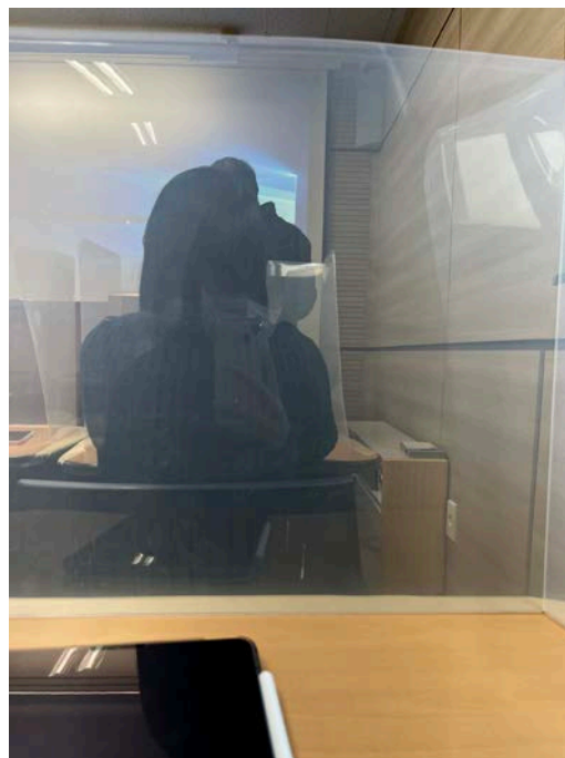
(圖 4)學校課桌上的防疫道具。