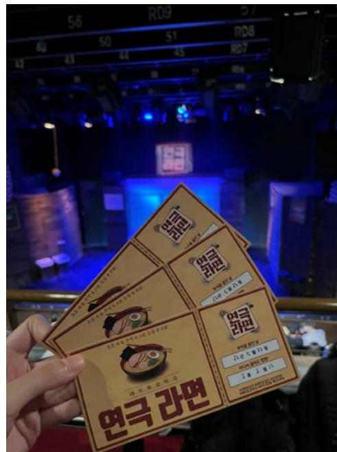
(圖 2)HOW FRIEND 交流活動。與組員 一起去看劇場公演。