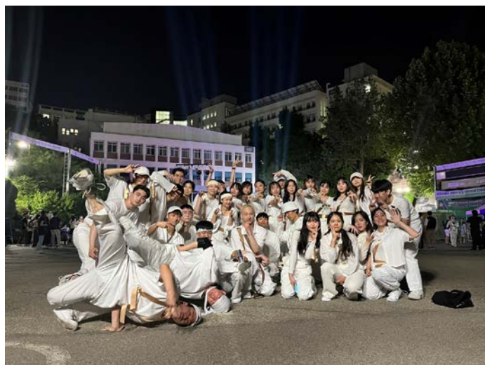
(圖 5)Morelib 活動演出—校內工院校慶