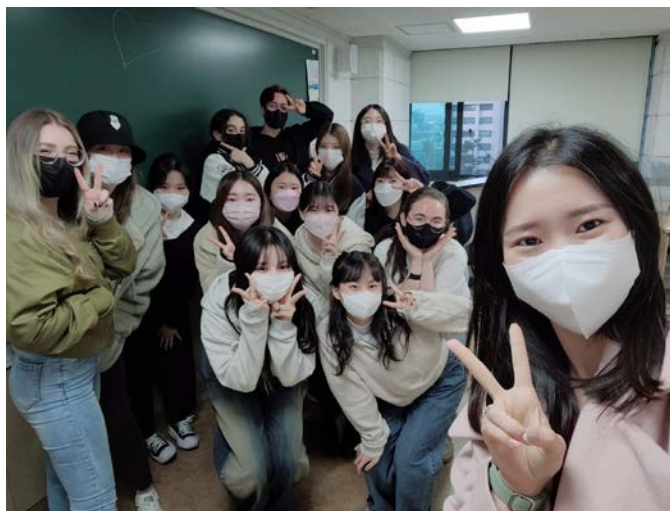
(圖 10)語學堂 4 級結業式。與同學老師合影。