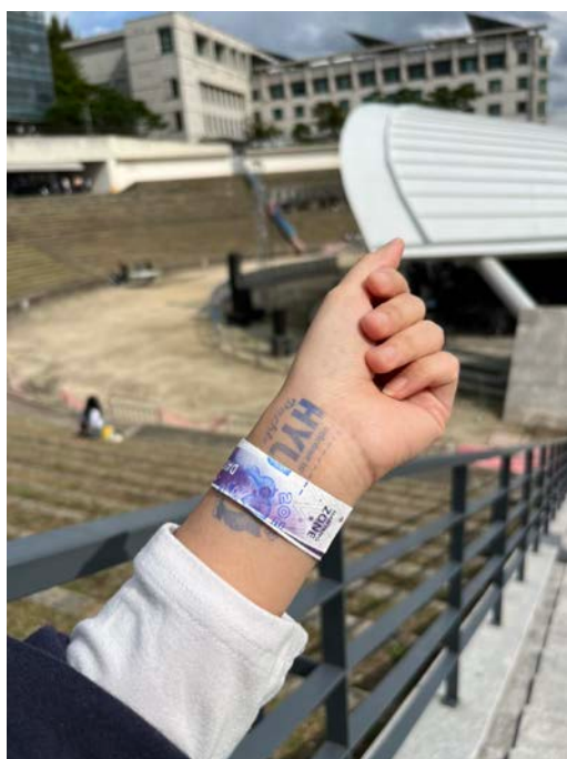
(圖 13)秋季校慶入場手環。