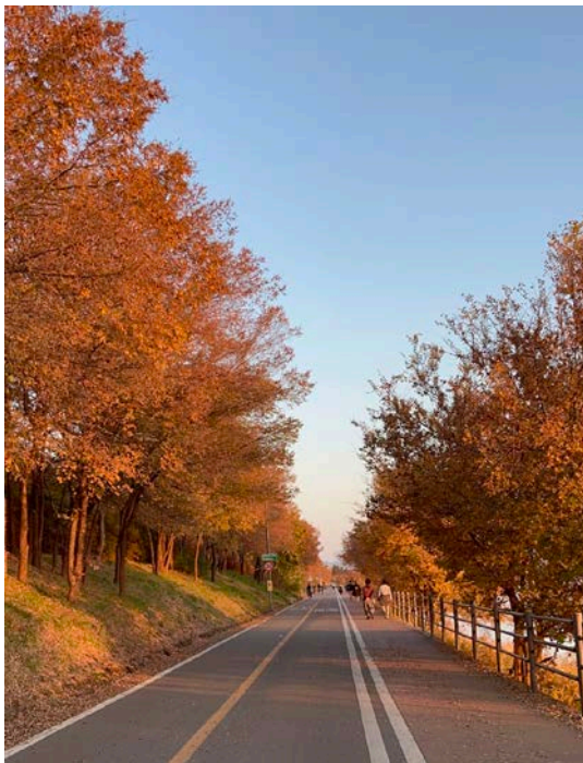
(圖 17)漢江騎腳踏車之秋景超漂亮！