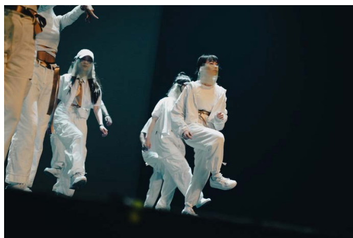
(圖 7)Morelib 活動演出-首爾 THE UNION 活動公演