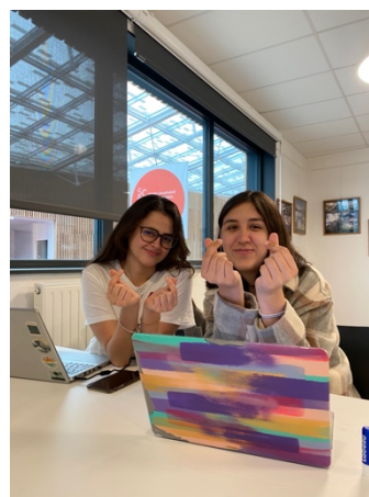
（與墨西哥同學組內討論）

經過亞洲文化多年來的沈浸影響，我們學習到的道理一直以來都是以和為貴，遇到不公義的則是忍一時風平浪靜。在歐洲會導致自己如同溫水煮青蛙，沒意識到權益及名聲全丟失，漸漸地人家會認為你的發言一點份量都沒有，學著為自己發聲相當重要（觀點套用在交朋友上也相同）。歐洲人思想開放，願意承認錯誤，也不吝嗇於讚美別人，所以能有條有理說服對方，學習良好的表達是我建議大家在歐洲生活的必備技能。