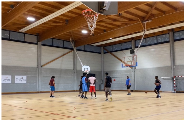
(與當地人一起打球)

籃球還是一項需要團隊溝通配合的運動，我需要使用法文來溝通，正因為是感興趣的主題，學習起來格外得心應手， 法文與英文能力 同時進步非常快。