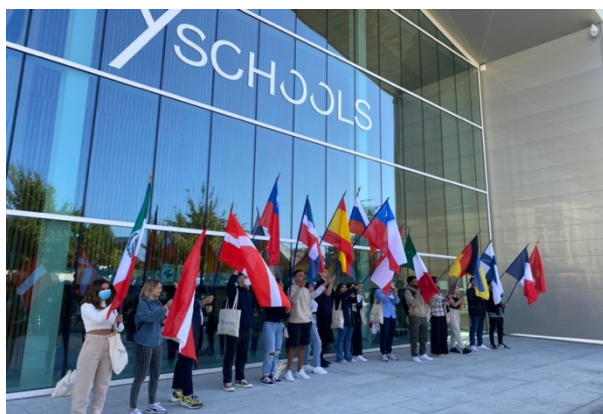
(各國交換生舉旗照片)

交換期間，走訪了 20 個歐洲國家。過程中見到了許多不同的人事物。東西南北歐分別存在鮮明的特色，一整年的時間體驗了 歐洲四季 ，且最富風俗民情的歐洲節日都沒有錯過，例如：歐洲人最看重的聖誕節、基督教主顯節、法國國慶、歐洲文化遺產日。旅行是一大磨練自己的好機會。不論事行前的 規劃及預算分配 或是 時間管理 上的掌控。數不清的不可預見狀況更是大挑戰，例如：班機無故取消，疑似炸彈的遺留行李，交通罷工等、Covid 政策更改。得以最短的反應時間想出最好的 危機處理 方法。然而，當獨自旅行時遇見突發狀況會更艱難，必須 獨自判斷後行事 ， 抗壓性及韌性 隨之提升。