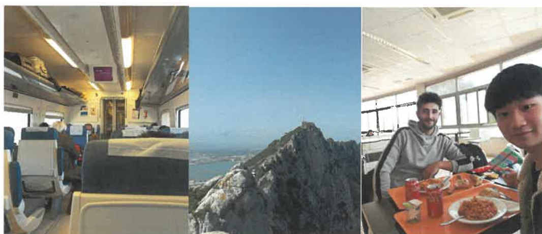
上圖依序為西班牙國鐵 renfe、旅行團至直布羅陀出遊、與學伴合照

位於南歐的西班牙物價算便宜，民生用品及食材大致跟台灣價錢差不多，因此僅需要攜帶一些台灣特有或習慣使用的個人用品即可，而發源於安達魯西亞的 tapas 文化非常歡迎大家多加嘗試，尤其食量較小或不太餓的時候很適合當一餐外食。哈恩及隔壁城市格拉納達有當地的旅遊團，價格便宜還可以認識朋友，滿推薦可以參加看看的。而 FB 社團(台灣歐洲交換學生、台灣交換生/留學生在西班牙)二個社團可以透過徵求旅行夥伴的方式認識到歐洲及西班牙各處的學生，甚至可以徵求住宿地點省下旅費。