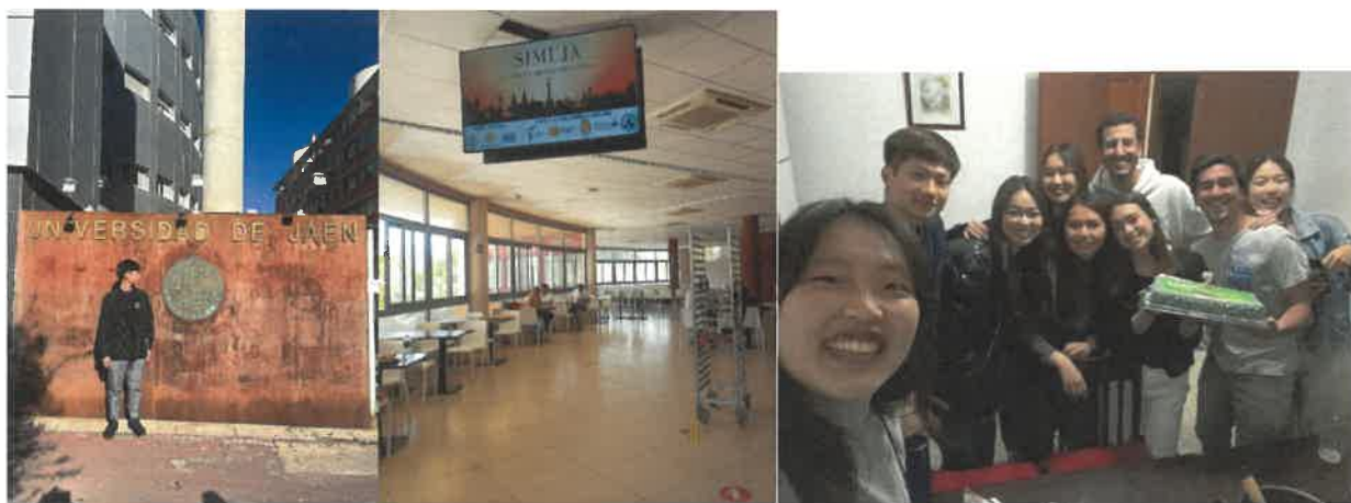
上圖依序為校門口合照、學生餐廳、多國交換生聚餐之照片

哈恩大學占地廣闊設施資源應有盡有，語言中心開設的語言課程教學完整，有 A1-C2分級的綜合、文法及口說課程；在半年交換期間我透過 A1.1的西班牙文課程學習到完整的入門課程，就像在上語言學校一樣，除了單字和文法，老師也會透過初作業以及上台報告等方式讓我們練習課堂中所學，而期末考則分為聽力、口說、閱讀、寫作四大項各25%；不過因為透過姊妹校交換的關係，完全不需要多付學費就可以上到優質的西班牙文課程；上課的同學同樣都是來自世界各地的交換學生，不僅可以學習到符合自己程度的西班牙文還能認識很多國際朋友，而最後我在這門課取得 B(8.2/10)的成績。