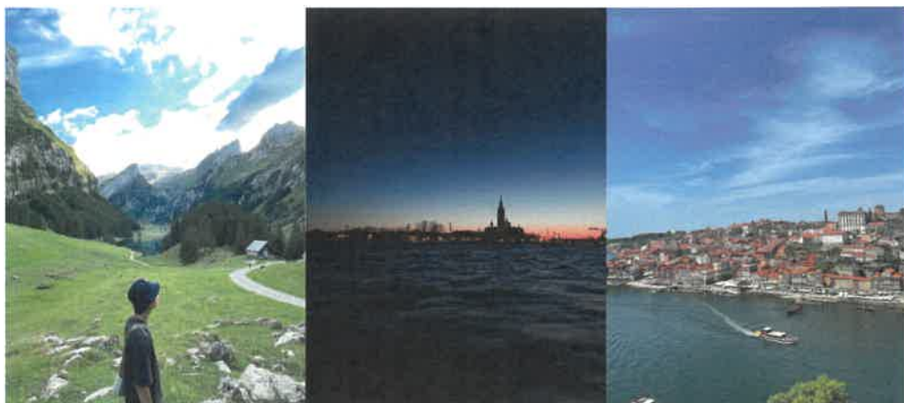
上圖依序為瑞士出遊、義大利威尼斯夕陽、葡萄牙波多河景之照片

於歐洲各國走訪期間學會更靈活地處理突發事件增進臨機應變能力，例如有次在義大利等候國鐵時發現班表遲遲沒出現月台號碼，向站務詢問才知道被取消了，需要換票購買另一班，因此後來的旅程安排時會預留時間緩衝交通可能出現的問題。另一次則是在巴黎遇到地鐵罷工，所有地鐵停駛，而公車則是受到罷工人潮影響將會誤點及減少班次，原定要一小時車程的凡爾賽宮則花費二小時才能抵達。與不同旅行夥伴間相處使我的團隊領導有所增益，在十多次的旅程當中遇到了形形色色的人，有台灣人也有外國人，有時會認為自由的英文實在不夠好，無法與新認識的朋友好好深入聊聊一些喜歡的話題。在這半年的交換生涯中，我拜訪了18個國家，其中有三個甚至拜訪了二次，見識到了稀有的義大利卡布里島藍洞、看到了挪威壯麗的峽灣、冰川地形、去到了山丘綿延的瑞士仙境、參與到了義大利威尼斯的面具節等等，而且歐洲內各國機票都不貴，甚至可能比客運、鐵路還便宜，在歐洲大陸內移動還可以選擇夜間巴士，不僅睡一覺就可以抵達目的地，還可以省下一晚的住宿費，讓旅費花在更想買、更想吃的東西上。