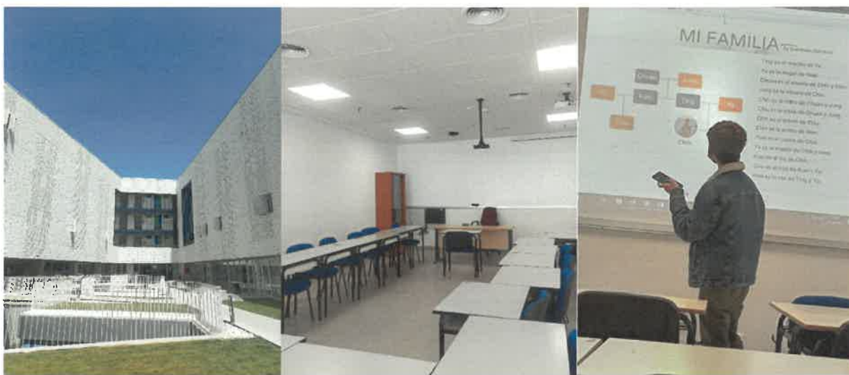
上圖依序為語言中心、上課教室、上台報告之照片

此外，除了西班牙文外，透過至德國、奧地利及瑞士旅遊，對於德文也充滿興趣，在當地旅遊期間，向德國交換生學習了一點基本的德文問候語、結帳用語等，回台後也想繼續學習德文。